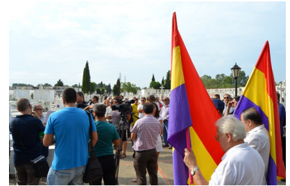
Inauguración como lugar de memoria democrática a fosa común do cemiterio de Puerto Real

O concepto de memoria democrática fai referencia ao recoñecemento público das vítimas da ditadura franquista e da Guerra Civil (1936-1939), así como á eliminación de símbolos que glorifican o Réxime. O seu obxectivo é garantir a xustiza, a verdade e a reparación para as vítimas, promovendo unha conciencia colectiva crítica. Isto débese a que, a diferenza doutros países que xulgaron os seus ditadores, como fixo Alemaña co nazismo, a complexa transición cara á democracia iniciada por España tras a morte do ditador, priorizou a reconciliación nacional mediante pactos políticos que deixaron en segundo plano o xuízo sobre as atrocidades da ditadura. Neste contexto, nos últimos anos, apróbanse unha serie de normas e desenvólvense unha serie de accións que procuran arranxar esta inxustiza.