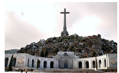
Abadía do Valle de los Caídos

2. Lei de memoria democrática (2022): a lei anterior tivo limitacións importantes, xa que non anulou os xuízos franquistas nin abordou a complicidade de certas institucións na ditadura. Así, para ampliar e actualizar a lei anterior, o Goberno de Pedro Sánchez aproba esta lei, que ten como principais novidades: