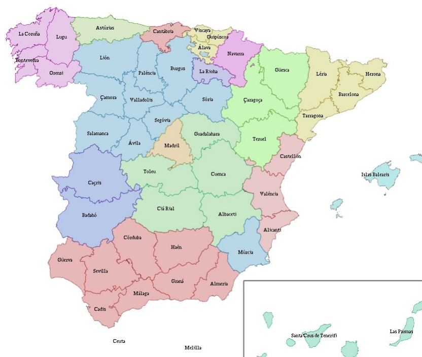
Mapa provincial de España (autor Better-CC BY-SA 3.0)

As comunidades teñen gobernos propios (como a Xunta de Galicia ) e parlamentos rexionais (o Parlamento de Galicia ), elixidos democraticamente. Estas institucións teñen o poder para legislar e xestionar asuntos de interese rexional, como a educación, a sanidade, as infraestruturas ou a cultura, dentro dos límites marcados pola Constitución e o seu Estatuto de autonomía, xa que non todas as comunidades autónomas teñen as mesmas competencias. Esta descentralización pretende adaptarse ás necesidades específicas de cada rexión, intentando achegar unha xestión máis próxima á cidadanía e ás súas necesidades.