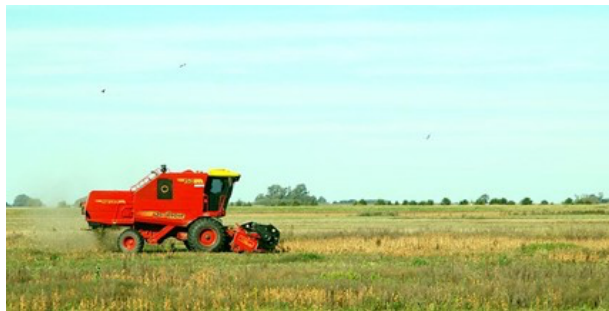
"Junín campo 20120430 2"

A agricultura é o conxunto de técnicas e coñecementos para cultivar a terra e, ata a Revolución Industrial, constituía a principal fonte de riqueza e era a base da economía. Na actualidade, nos países desenvolvidos, perdeu moito peso, aínda que segue a ser necesaria como fonte de alimentación humana e subministradora de materias primas industriais.