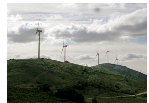
"Parque eólico Serra dos Caracois (Andrés Franchi Ugart CCBY-SA 3.0)

Pola súa vez, a industria podemos clasificala en: