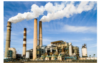
"Industria-1827884 1280"

As fontes de enerxía son os recursos que proporcionan a forza necesaria para levar a cabo un traballo. Poden ser de diferente tipo: