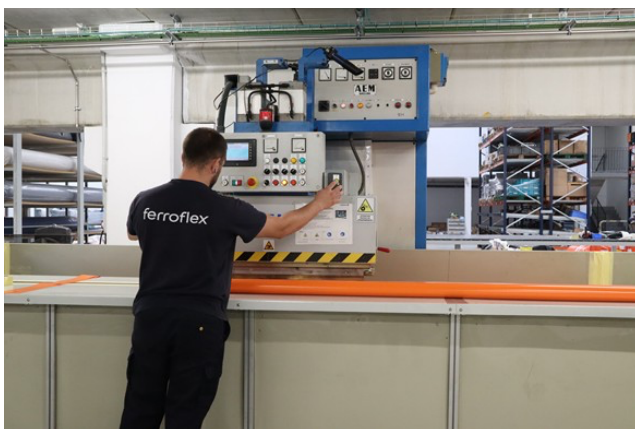
"Empregado de fábrica"