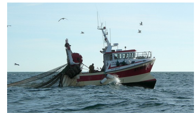
"Barco de arrastre"

A pesca é a actividade destinada a obter recursos alimenticios das augas do mar, dos ríos e dos lagos, como peixes, crustáceos ou moluscos, aínda que a piscicultura -cultivo controlado de especies animais e vexetais acuáticas en viveiros- está en auge debido á sobreexplotación pesqueira.