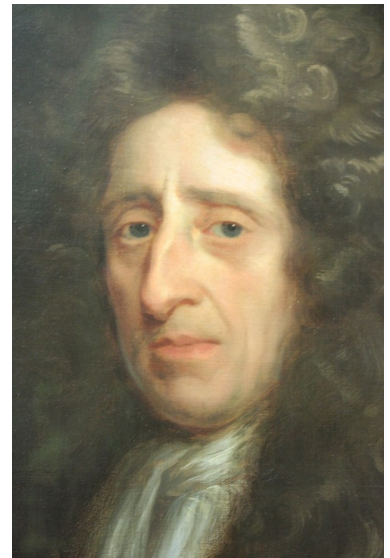
Retrato de John Locke, na National Portrait Gallery (Godfrey Kneller. Dominio público)

A súa máxima é: " Onde queira que a lei termine, a tiranía comeza ".