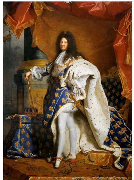
Luis XIV. O rei Sol. Rigaud.