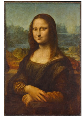
A Gioconda . Leonardo da Vinci. Museo do Louvre. Dominio público.

A perspectiva e o óleo cambian as técnicas herdadas do gótico. Destacan autores coma Masaccio, Botticelli e os xigantes do Cinquecento: Da Vinci (A Gioconda, A derradeira cea), Rafael (A escola de Atenas) e Michelangelo (a Capela Sixtina).