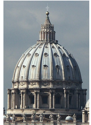
Cúpula de San Pedro do Vaticano. Michelangelo. Dominio público.