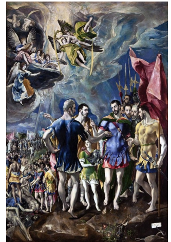
O martirio de San Mauricio (1580-82). Patrimonio nacional. Pazo do Escorial (O Greco. Dominio público).