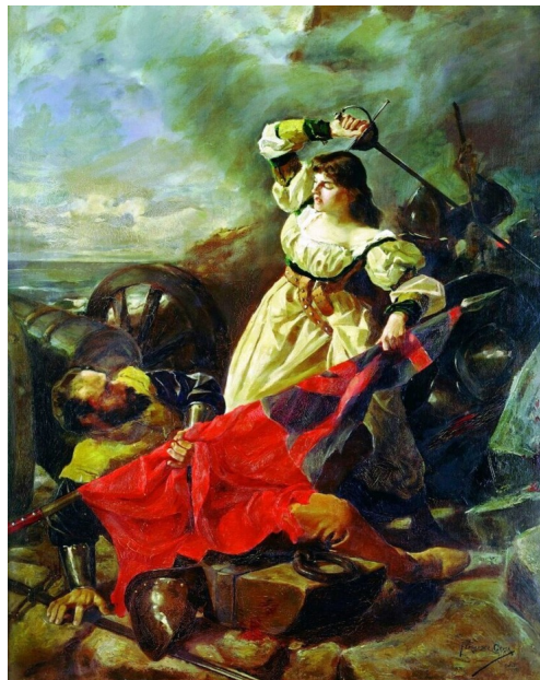
María Pita cargando contra os ingleses

Pero a maioría tiñan unha vida vinculada ao matrimonio , dedicadas ao coidado dos seus e pasando penurias. A muller do pobo tiña unha vida extremadamente dura e as súas historias sempre se escribiron con minúsculas ou non se escribiron.