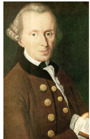
Immanuel Kant, Autor: Becker

O filósofo alemán I. Kant (Königsberg 1724-1804) criticou as éticas materiais por subxectivas e heterónomas e, como xa vimos, a norma non se xustifica na vontade ou conciencia do individuo, senón nun fin externo. Para Immanuel Kant o que ten auténtico valor moral non son as accións que están dirixidas pola inclinación natural e incuestionable do ser humano á busca dun fin, senón as que teñen como obxectivo o cumprimento preciso do sentido do deber . Por exemplo, ten pouco ou ningún mérito moral devolver o diñeiro que un atopa por temor ás consecuencias que ten incumplir a lei. Pero si o ten cando se fai por acordo da conciencia moral coa súa pura obriga de respectar os bens alleos, aínda que o castigo de incumplir a lei xamais puidese alcanzarte, é dicir, aínda que ninguén te vise. Segundo exemplo, golpeas outro coche ao aparcar no cal non está o condutor, e deixas o teléfono no parabrisas para avisalo e dar parte. Por que o fas? Por que hai xente diante e dáche vergoña, ou por que consideras que é o teu deber facelo? Esta é a diferenza entre actuar por un fin ou por deber.