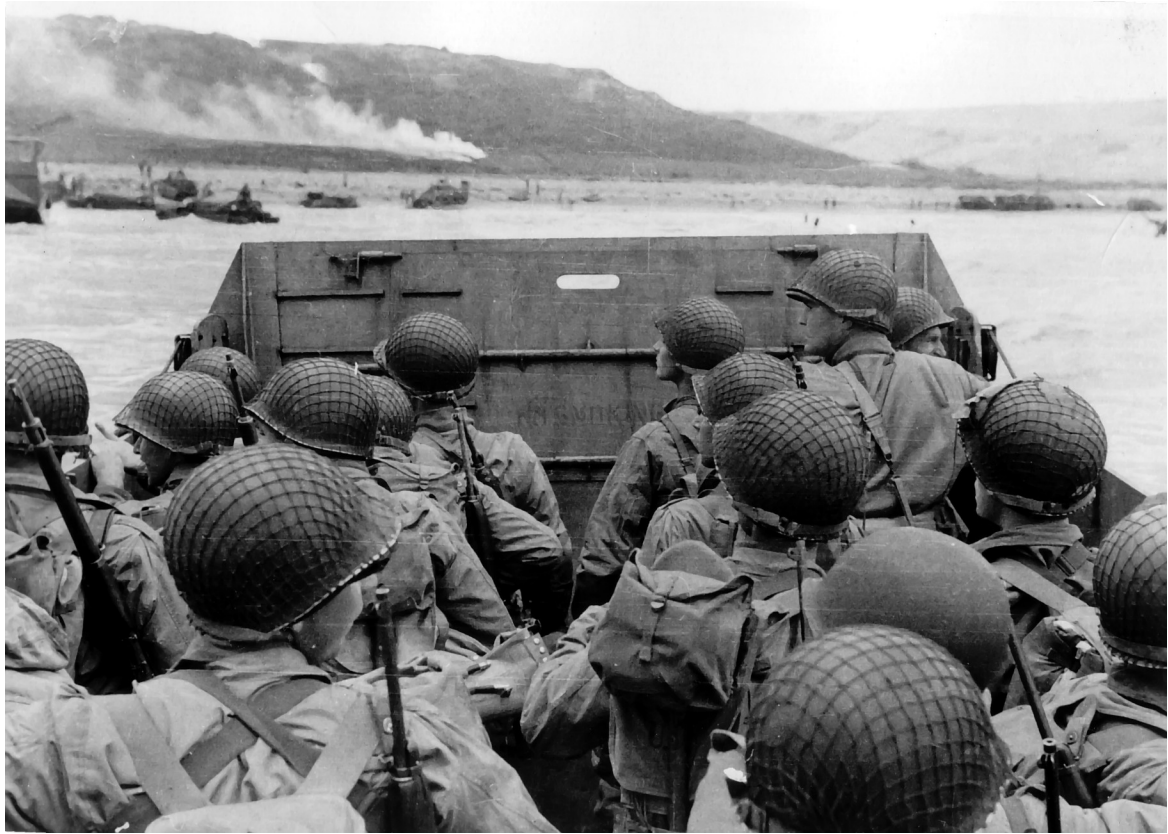
Soldados americanos chegando á praia Omaha