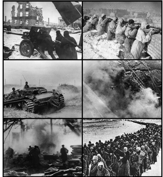
Colaxe da batalla de Stalingrado

devir posterior do conflito, xa que supuxo a derrota total das tropas alemás na fronte do leste e propiciou o avance imparabile soviético cara a Berlín.