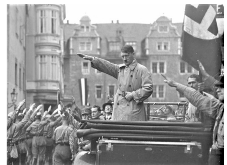
Adulacións a Hitler en Bad Godesberg

En Alemaña, coa chegada ao poder de Hitler no ano 1933, tamén se vai poder apreciar un cambio radical nas dinámicas das relacións internacionais. Aquí, tras o abandono alemán da Sociedade de Nacións, as limitacións impostas polo Tratado de Versalles irán quedando atrás ante o dobre obxectivo, declarado por Hitler, de crear unha Alemaña que aglutine toda a poboación de orixe xermánica e de dotala dun espazo vital para abastecela, controlando os territorios do leste de Europa. En 1935, logo de celebrar un referendo auspiciado pola Sociedade das Nacións, procederá a anexionar a rexión do Sarre e a restablecer o servizo militar obrigatorio. Ante a pasividade das democracias internacionais, en 1936 ocupará a zona desmilitarizada de Renania e, en 1938, as tropas alemás entrarán en Viena procedendo posteriormente á incorporación de Austria ao Reich no denominado Anschluss .