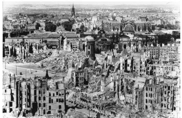
Dresde despois dos bombardeos aliados

Tamén debe ser considerada unha guerra total, xa que no seu afán por resultaren vitoriosos, os principais países implicados puxeron á disposición do esforzo bélico todos os recursos dispoñibles, involucrando o conxunto da poboación sen distinción entre militares e civís. De feito, as mortes de civís serán outra das características do conflito. Os bombardeos indiscriminados de cidades buscando causar o maior dano posible entre a poboación civil foron comúns en ambos os bandos, destaca, polo lado do Eixo, o