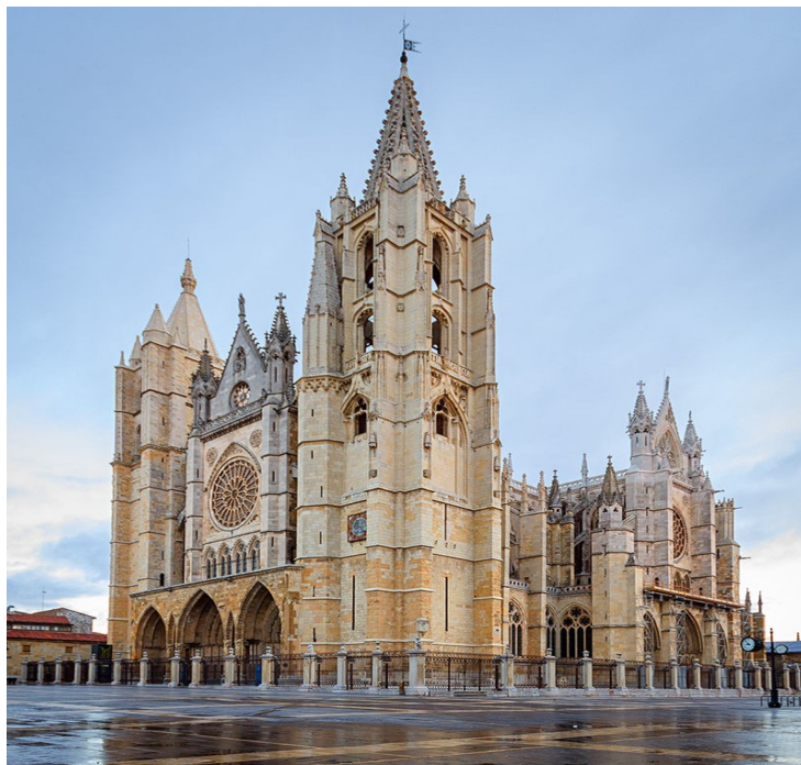
"Catedral de León"

Na península Ibérica , no s. XIII os exemplos góticos máis importantes son as catedrais de Burgos, Toledo e León. No s. XIV destacan a catedral de Santa María del Mar e a de Palma de Mallorca. No s. XV destaca o gótico hispano-flamenco da catedral de Sevilla.