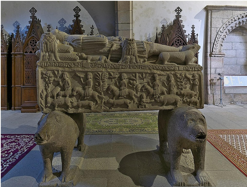
"Sepulcro de Andrade 'o Bo' en san Francisco de Betanzos (1397)"

É moi interesante neste período a escultura funeraria , da cal temos bos exemplos en Galicia, coma o sepulcro de Fernán Pérez de Andrade 'o Bo' da igrexa de San Francisco de Betanzos.