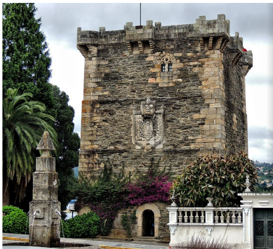
"Torre dos Andrade".

En 1431, o señor de Betanzos e Pontedeume, Nuno Freire de Andrade 'O Malo' provocou a revolta irmandiña dirixida polo fidalgo Roi Xordo, e morrerá no intento. O exército dos Andrade e do arcebispo de Santiago afogou a revolta.