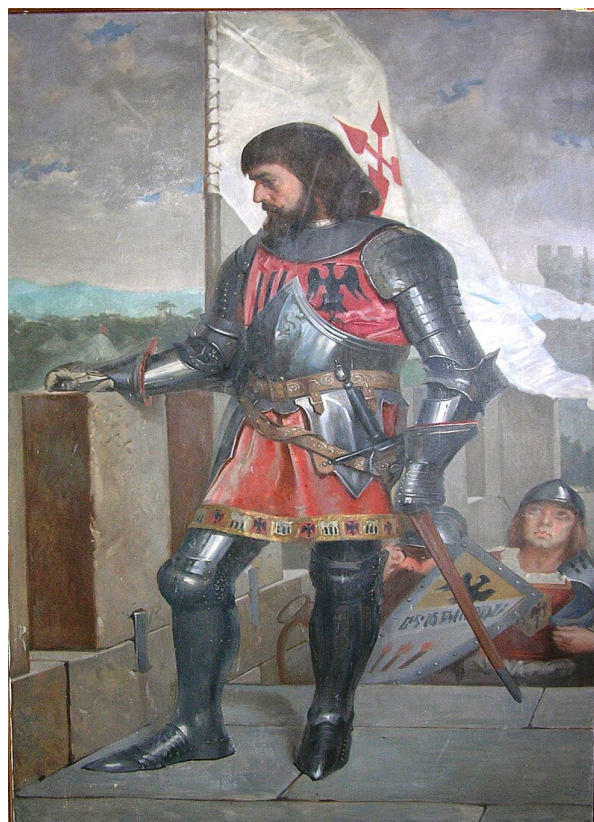
Lenzo que amosa a figura do mariscal galego. Foi decapitado o 3 de outubro de 1483, xunto co seu fillo Pedro, diante da catedral de Mondoñedo e por mandato dos Reis Católicos.

A dirección de Pedro Álvarez de Soutomaior e o mariscal Pardo de Cela neutraliza os irmandiños cerca de Santiago, e foron castigados a reconstruír as fortalezas que derrubaran.