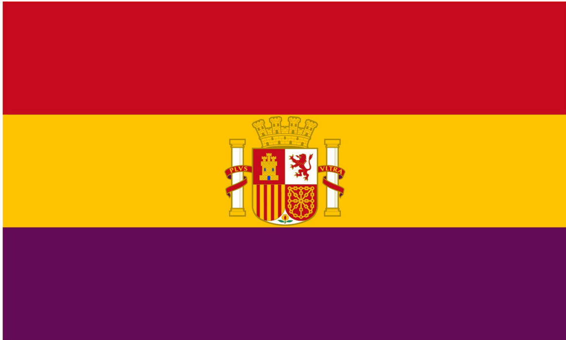
Bandeira da II República