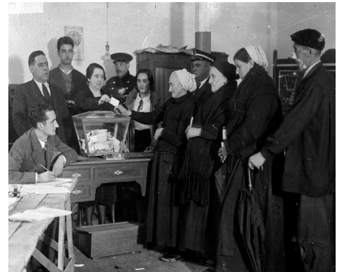
Figura 4: Referendo sobre o Estatuto vasco-navarro do 5 de novembro de 1933 en Éibar

Dende a perspectiva do Goberno, o período republicano divídese en tres etapas: