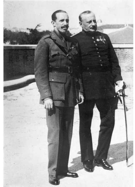
Primo de Rivera e Alfonso XIII-Primo de Rivera

Tras o fin da ditadura, o rei intentará salvar a súa situación mandando formar un novo Goberno e restaurando a Constitución, nun intento de recuperar o modelo político da Restauración. Porén, a oposición ao rei era moi forte, estando a súa figura directamente vinculada co ditador. En 1930, a oposición asina o Pacto de San Sebastián , buscando concorrer xuntos ás eleccións e instaurar unha república como alternativa á monarquía.