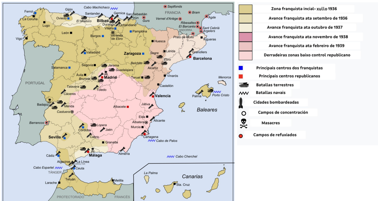
Mapa xeral da Guerra Civil española (1936-1939).

A evolución da guerra acostuma a dividirse en tres grandes etapas: