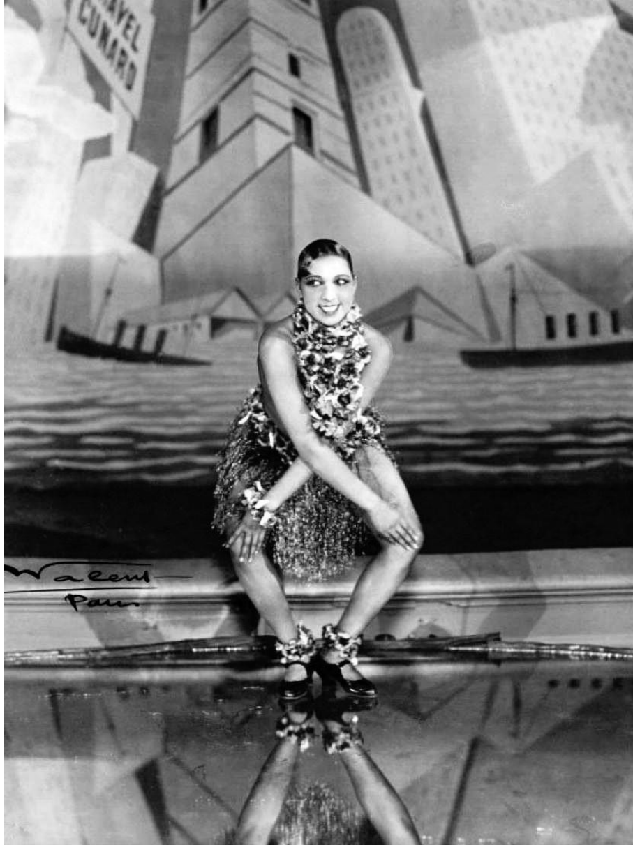
Josephine Baker bailando o charlestón no Folies-Bergère, París (Walery-PD by age)