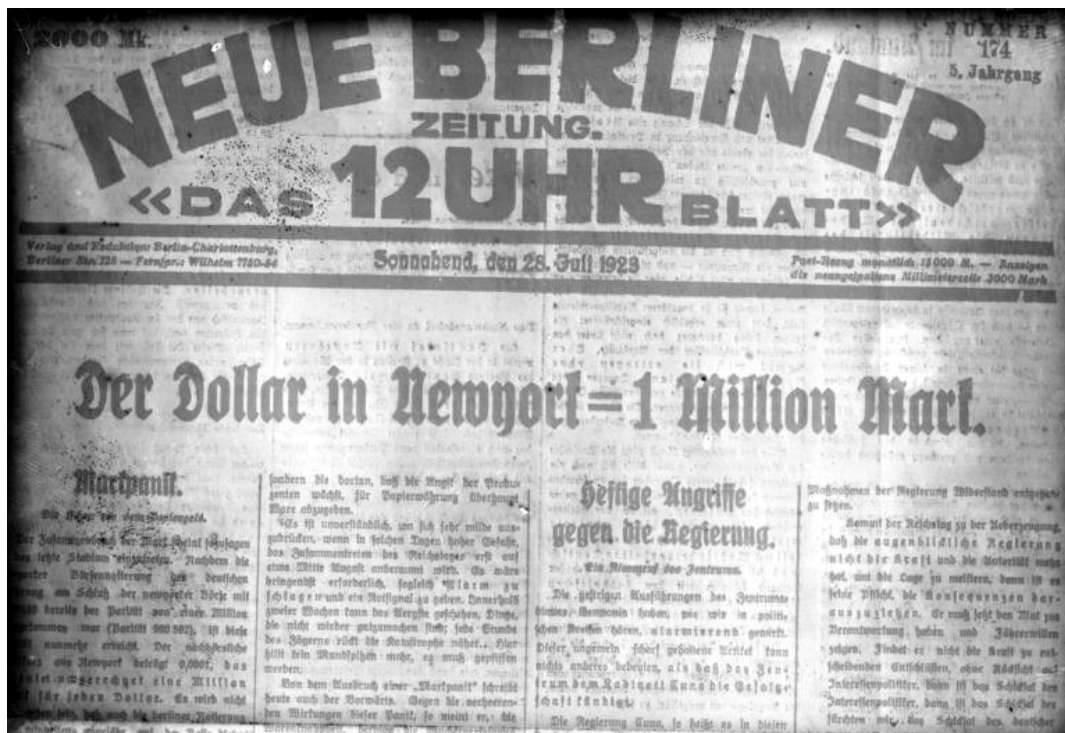
1923. Xornal alemán anuncia que 1 dólar americano equivale a 1 millón de marcos alemáns

As perdas demográficas, a destrución das infraestruturas e o pagamento das débedas contraídas complicaron o retorno á paz. A manifestación máis clara da crise foi o incremento desmedido dos prezos ( hiperinflación ) e o paro. Esta situación foi especialmente complicada na Alemaña, que ademais tiña que facer fronte ao pagamento das reparacións de guerra impostas no Tratado de Versalles.