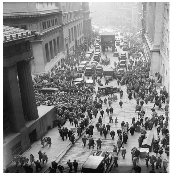
Crac de Wall Street. 1929. (Autor descoñecido- PDM 1.0)

O efecto do crac da bolsa na economía real foi moi rápido e trouxo consigo, primeiro, o colapso da economía dos Estados Unidos e, despois, o da gran maioría do mundo, debido á dependencia que tiñan dos investimentos norteamericanos. Foi o que se deu en chamar a gran depresión .