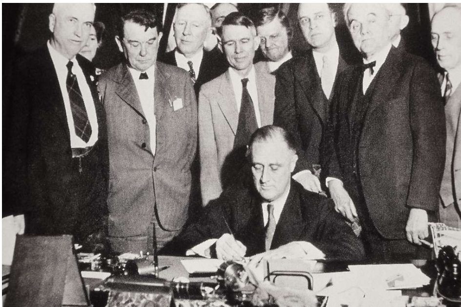
O presidente Roosevelt asinando a lexislación do New Deal

A procura de medidas alternativas para solucionar a crise chegará aos Estados Unidos no ano 1933, logo da vitoria de F.D. Roosevelt nas eleccións presidenciais. O cerebro de detrás das novas políticas ou do New Deal , como foi bautizado, será o economista J. M. Keynes, que defenderá a necesidade de revisar os principios do liberalismo clásico.