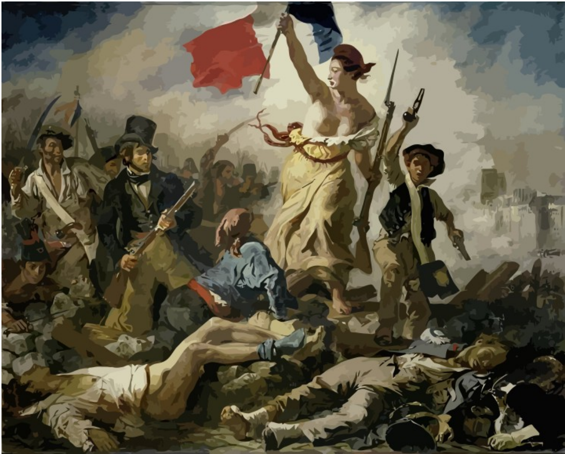
A Liberdade guiando o pobo