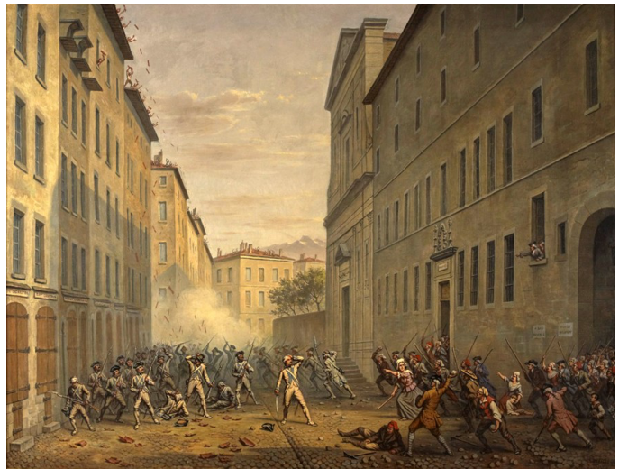
"O día dos azulexos" (Alexandre Debelle CC BY- SA)

En 1789, Luís XVI procedeu á convocatoria dos Estados Xerais , asemblea de orixe medieval de representantes dos tres estamentos, co obxectivo de aprobar novos impostos. Os representantes do terceiro estamento exixiron que se votase por individuo e non por estamentos, pois así serían maioría numérica e neutralizarían a alianza entre a nobreza e o clero, pero a nobreza e o clero negáronse. Esas reivindicacións foron expresadas a través dos chamados Cadernos de Queixas.