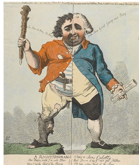
A Right Honorable (sic) Alias a sans culotte (Isaac Cruikshank CCO 1.0)

Tras o derrocamento de Robespierre, o goberno estivo controlado polos moderados, que limitaron os excesos revolucionarios e o poder executivo pasou a recaer no Directorio , formado por cinco membros escollidos polas Cámaras parlamentarias. O Directorio estivo vixente do 1795 ao 1799, cando Napoleón Bonaparte deu un golpe de Estado que permitiría a creación do Consulado, aínda que non se estendería moito, xa que en 1804 autoproclamouse emperador, iniciando así a etapa do Imperio francés .