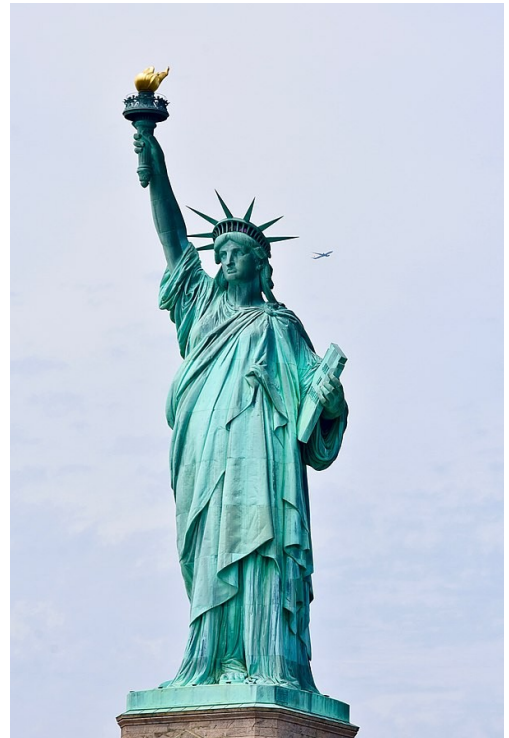
"Estátua da liberdade"

Posteriormente, o liberalismo como doutrina continuou evolucionando ao longo do tempo, pero mantén ata hoxe o seu enfoque central na proxección dos dereitos e das liberdades individuais.