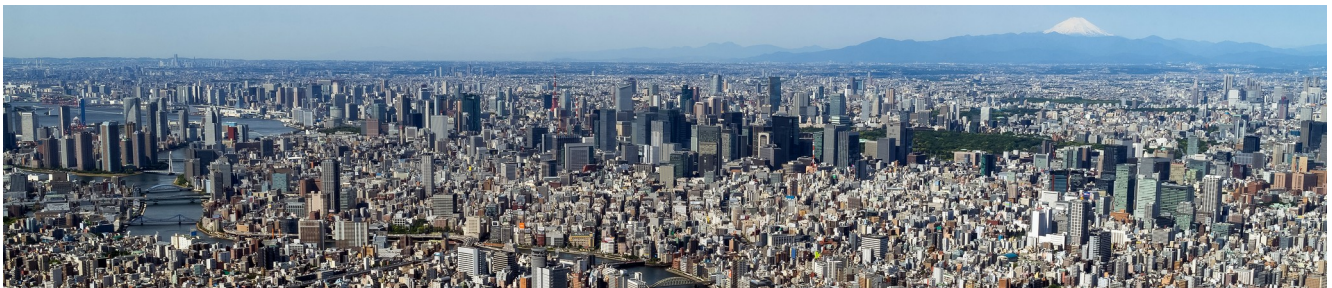
"Toquio con 38 millóns de habitantes"

- A cidade postindustrial. A partir da segunda metade do século XX as cidades fagocitan os seus arredores e convértense en cidades enormes, chegando mesmo a converterse en megacidades (máis de 10 millóns de habitantes: Toquio).