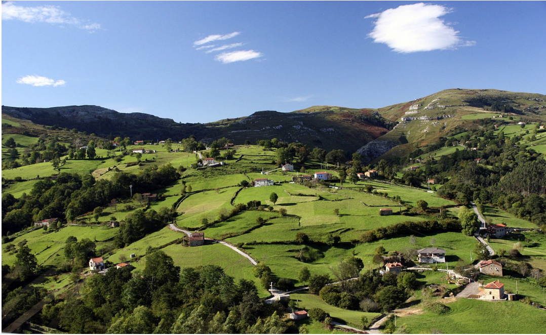
"Hábitat disperso do norte de España"