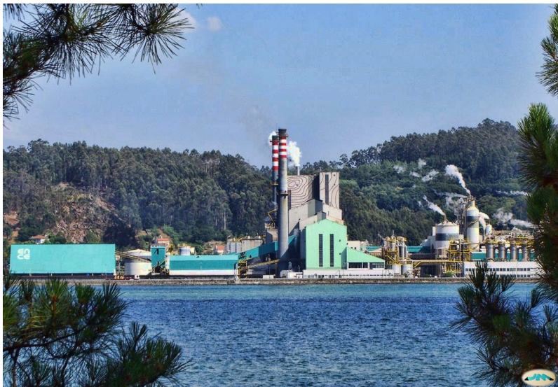
"Fábrica de celulosas Ence desde Lourido (Poio). Lourizán, Pontevedra, Galicia"(Juan Mejuto, contido libre)

Outra grande ameaza para o rural é a incursión das grandes multinacionais agroalimentarias e pasteiras que, co seu poder económico e político, fan auténticas fábricas de producir comida ou produtos que nalgúns casos provoca litixios coa poboación local. Como por exemplo, as macrogranxas e as celulosas.