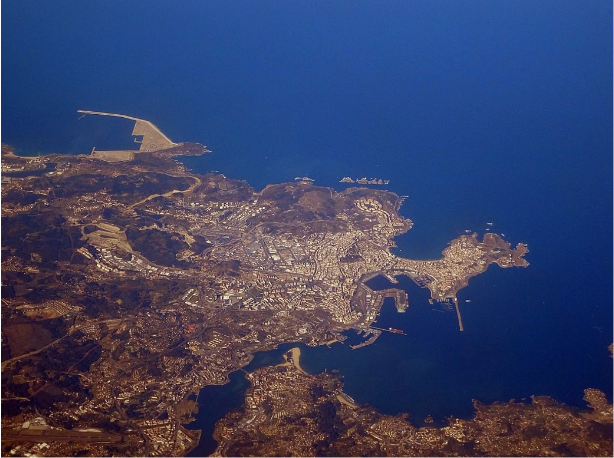
"Vista aérea da Coruña"