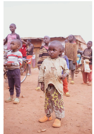
Africa subsahariana (Audy of Course, gratuita)

Con todo, este progreso non foi uniforme no mundo e, como podemos ver aínda hoxe, vivimos nun mundo profundamente desequilibrado, onde o consumo excesivo duns contrasta coa miseria máis absoluta doutros. Un mundo onde a explotación abusiva dos recursos naturais está comprometendo seriamente o futuro de todos, especialmente o dos habitantes dos países máis pobres. Nos últimos informes de 2021 do Laboratorio da Desigualdade Global, o 1 % da poboación do mundo con máis ingresos gana o dobre que o 50 % máis pobre do mundo.