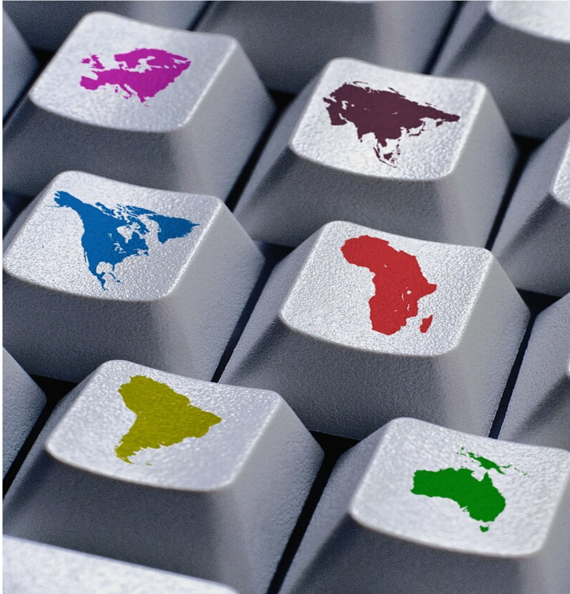
"Geokeys" (Tvpmp, dominio público)