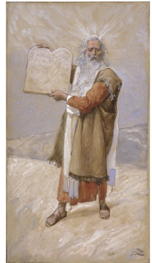
Moisés

Temos exemplos como a tradición xudeu-cristiá , onde a táboa dos 10 mandamentos que Deus lle entregou a Moisés no Monte Sinaí se converte no decálogo da súa moral, cuxa influencia chega ata os nosos días. E na tradición do Islam , a Sharia é a lei sagrada que historicamente rexeu todos os aspectos da vida islámica. Baseada nos textos sagrados como o Corán, a Sunnah e o Hadith, consideran que a lei e a moral proveñen directamente de Alá .