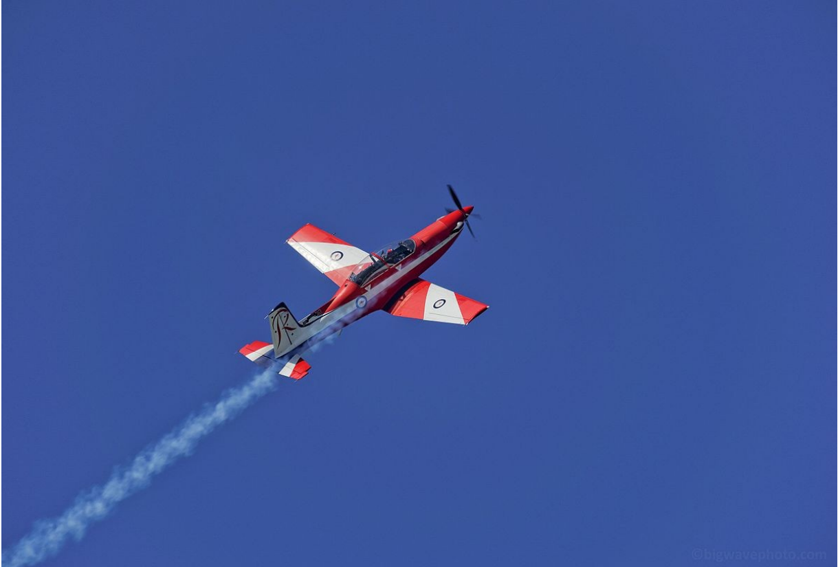
"Aerobatic aircraft flying maneuver "