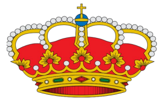
"Coroa real española"

As repúblicas , nas cales a xefatura de Estado e a Presidencia son elixidas polo corpo electoral para desenvolver o cargo durante un período de tempo. Distínguense entre: