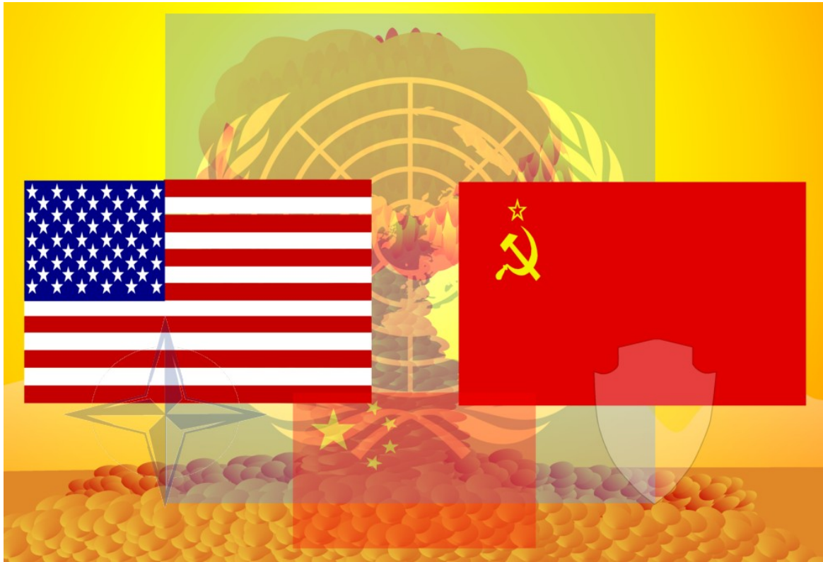
Guerra Fría (Anybody-CC BY-SA 4.0)