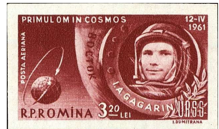
Sello romanés conmemorativo do paseo espacial de Gagarin