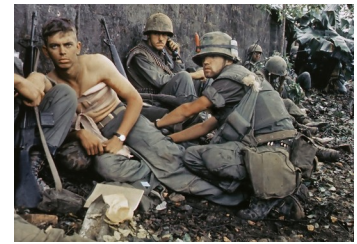
Marine americano ferido en Vietnam (autor descoñecido- CCO dominio público)