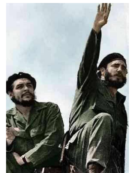
Che Guevara e Fidel Castro líderes da Revolución Cubana