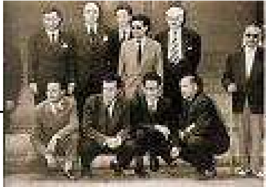
Mozos que fundaron o grupo nacionalista "Brais Pinto"