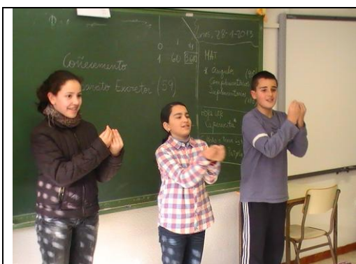
Signando a Canción da Paz