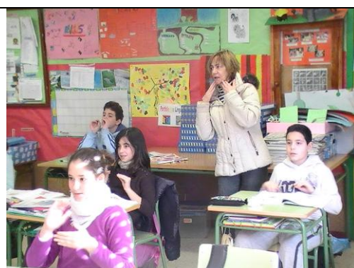
Expresando accións nas distintas linguas