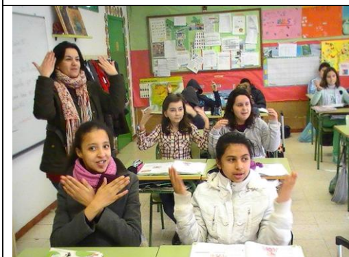
Signando e cantando