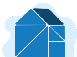
Competencia en organización escolar e colaboración

Integrar a autoavaliación e a reflexión crítica sobre o propio desenvolvemento profesional de xeito regular