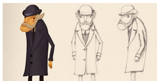
Cartel e bosquexos deseñados por Carlos Comendador