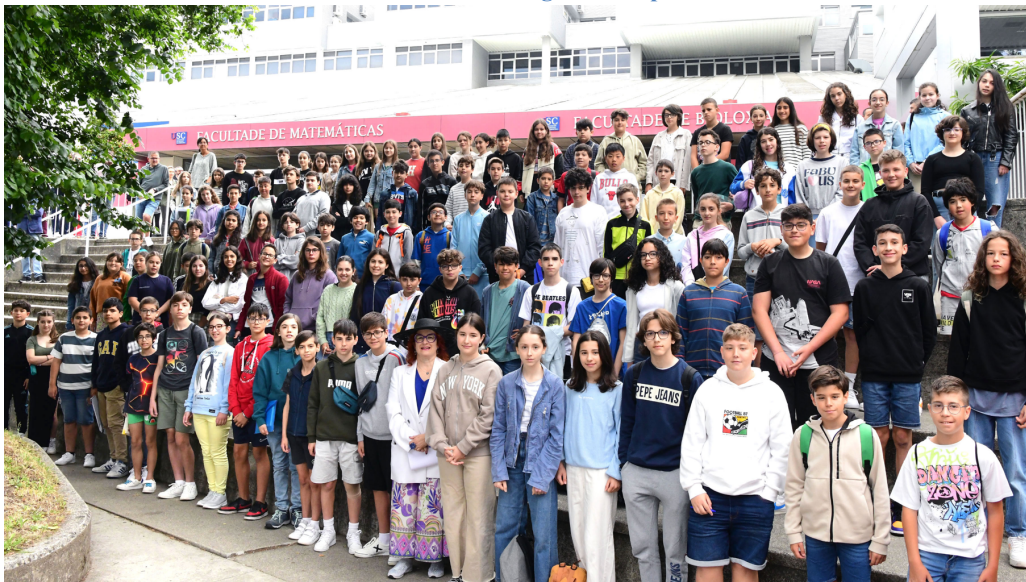
Foto de familia do alumnado presentado á proba na Facultade de Matemáticas en Santiago de Compostela en 2023