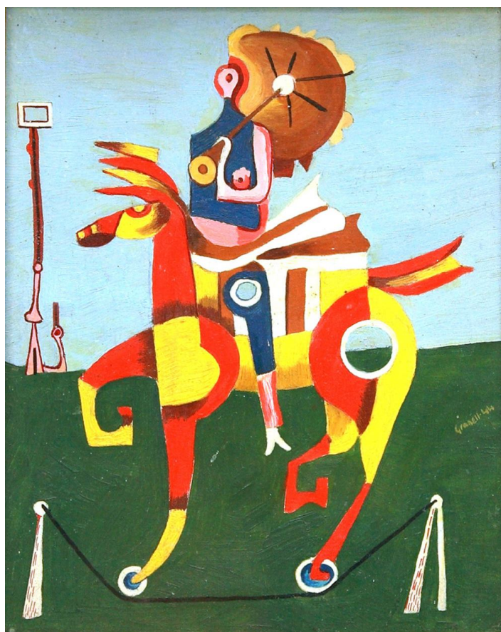
Eugenio Granell, Jinete del aire, 1944. Oleo/cartón, 26 x 20 cm. Colección Fundación Eugenio Granell

Bases Bases Bases Bases Bases Bases Bases Bases Bases Bases