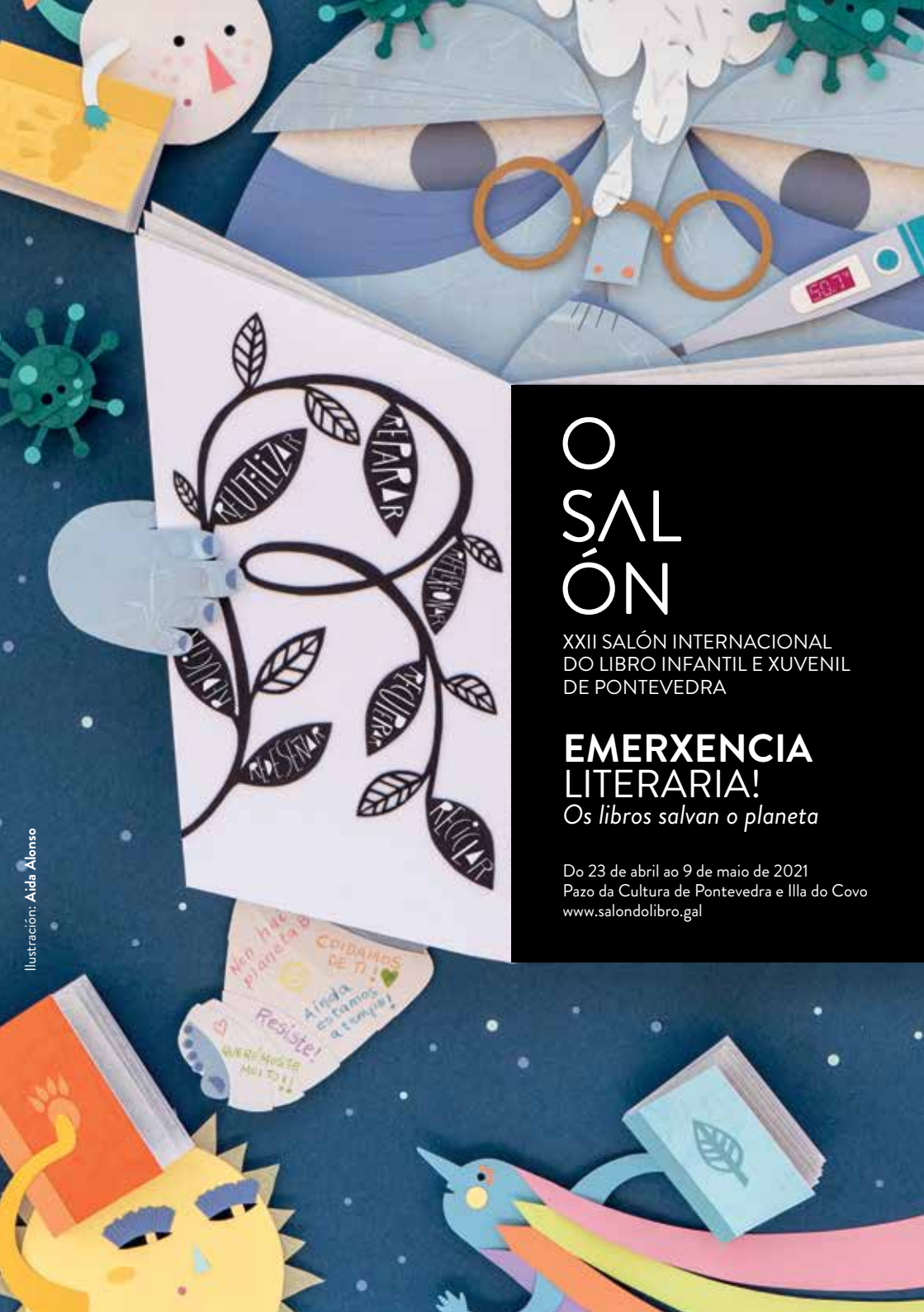
Ilustración: Aida Alfonso