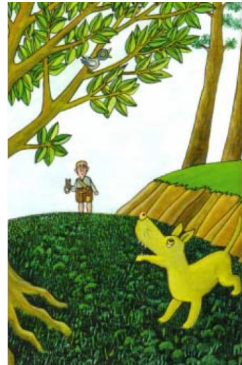
Debuxo de Xaquín Marín para "Memorias dun neno labrego"

Xosé Neira Vilas, Memorias dun neno labrego [adaptación]