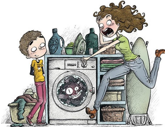
Ilustración de Víctor Rivas para "Escarlatina, a cociñeira defunta" de Leticia Costas

Ser cociñeiro, cando tes dez anos e moita fame o 85% do tempo, non é nada fácil. Eu trato de seguir as instrucións do libro de cociña con todas as miñas forzas, pero as cousas nunca son tan sinxelas cando te posmans á obra. Volveume pasar coas maldenas. Despois de bater, engadir os ingredientes e encher os sombreiriños brancos, acabei coas lentes, a camisa e o pelo todo enlarafuzado de crema amarela. Un auténtico noxo! Desta