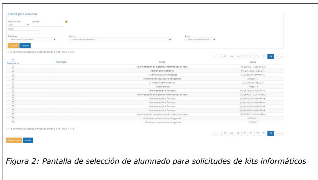
Figura 2: Pantalla de selección de alumnado para solicitudes de kits informáticos

Ao acceder a listaxe de alumnado aparecerá baleira, e mediante o botón Engadir o usuario terá acceso a pantalla onde poderá seleccionar a tódolos alumnos/as para os que vai solicitar kits.