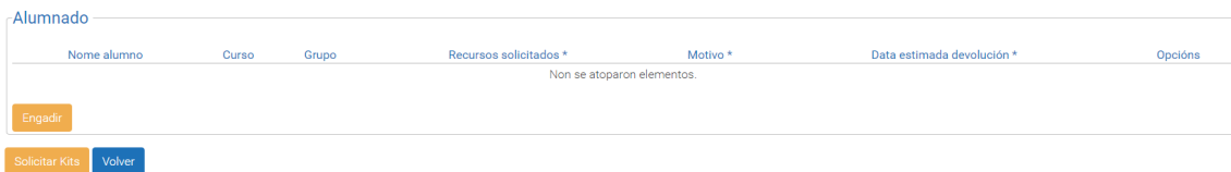
Figura 1: Pantalla de creación de solicitudes de kits informáticos

Ó premer no botón Crear o usuario accederá a pantalla de creación de solicitudes de kits informáticos.