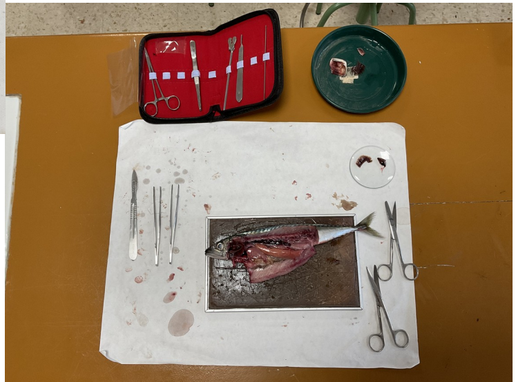
Imaxe da xarda na súa primeira fase da sección.