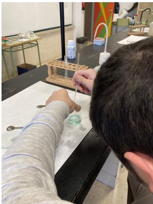
Alumnado preparando unha mostra para o seu posterior queimado.