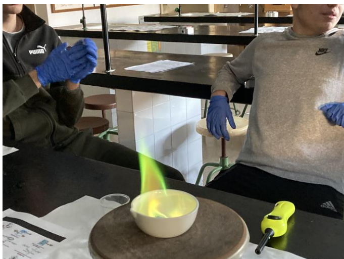
Alumnado visualizando a cor dunha disolución con cobre o queimarse.