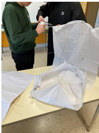
Alumnado cerrando o globo aerostático con diferentes tipos de papel