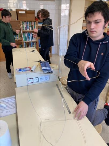
Alumnado realizando o esqueleto do globo aerostático.