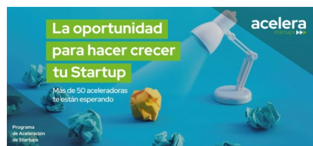
Programa de Aceleración de Startups