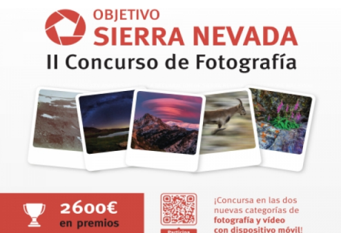
II Concurso de fotografía. Obxectivo Sierra Nevada 2024