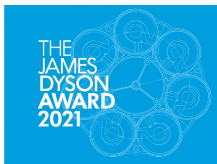
Concurso Internacional de Deseño