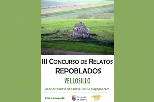
Concurso de Relatos