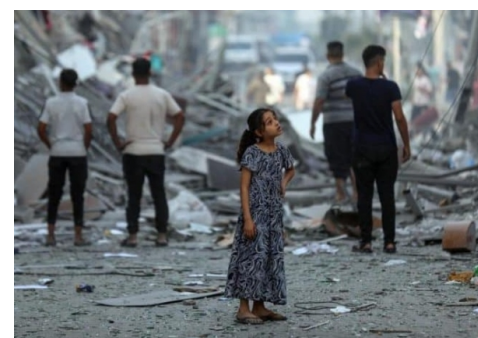
Proxectos de acción humanitaria no exterior