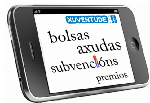
Boletín de bolsas, axudas e subvencións