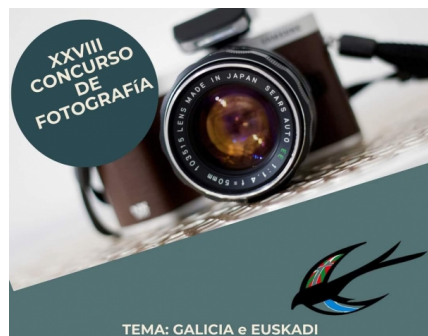
Concurso de Fotografía