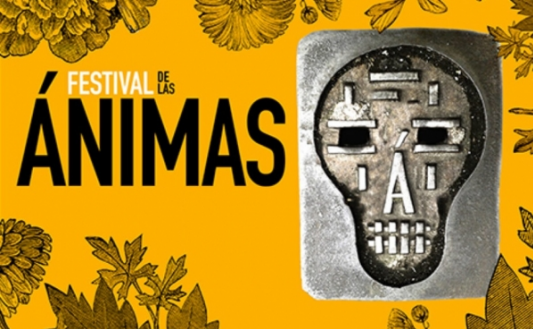
Relato curto de terror e fantasía "Festival das Ánimas"