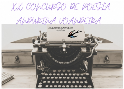
Concurso de Poesía Anduriña Voandeira