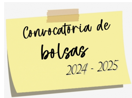
Últimos días!! Bolsas de estudos para o curso 2024-2025