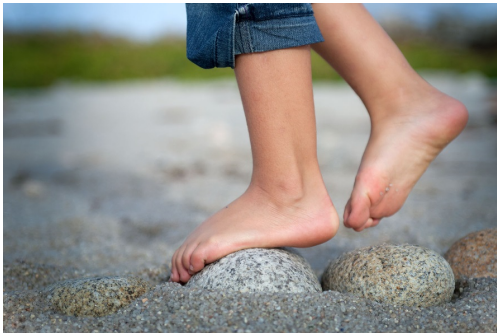
Curso de Monitor/a de actividades de tempo libre en Ferrol