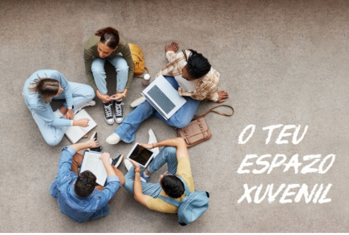
O teu espazo xuvenil. Subvencións a concellos de Pontevedra para equipamento de espazos xuvenís