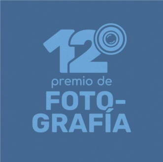
Premio de Fotografía Ciudad de las Palmas de Gran Canaria