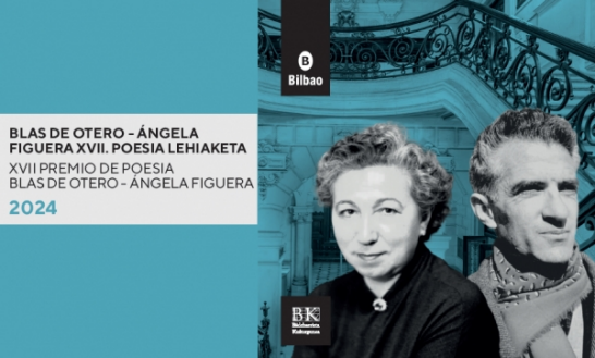
Premio de Poesía Blas de Otero-Ángela Figuera