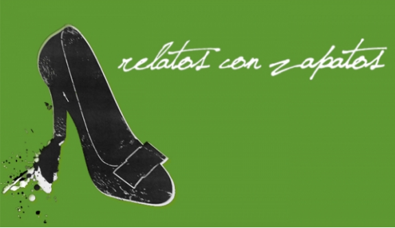
Certame de relato breve "Relatos con Zapatos"