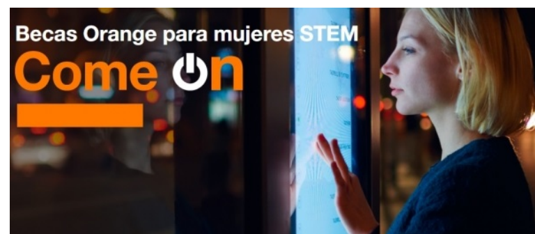
Bolsas Come On para mulleres