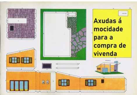
Axuda á compra de vivenda