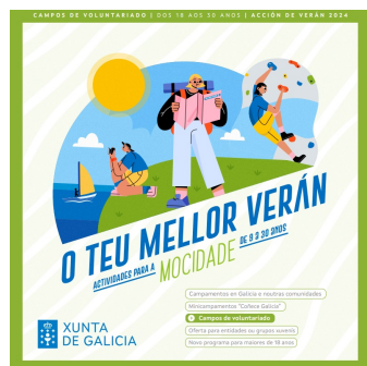
Campos de Voluntariado (de 18 a 30 anos...)