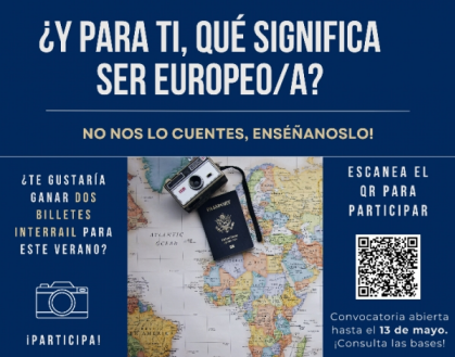
Concurso de Fotografía "Europa desde unha mirada moza"