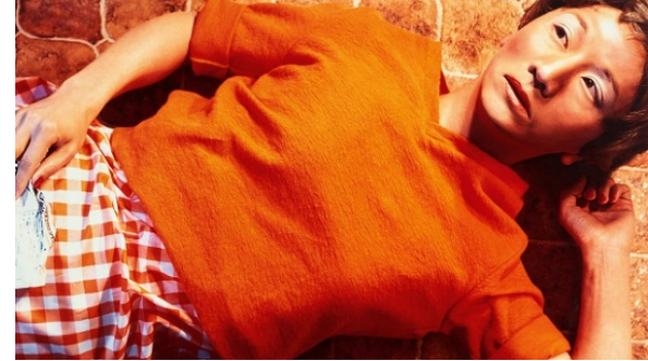
Fotografía e identidade: o autorretrato