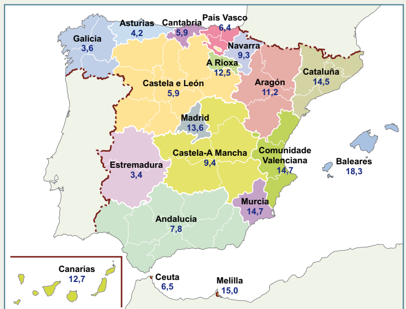
Porcentaxe de estranxeiros inscritos en de cada comunidade autónoma. 2014