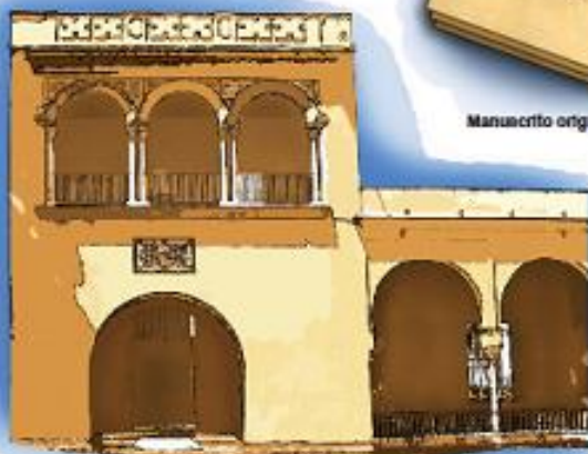
Infografía: Ana Cecilia Abarón Teatro: Manuel Inchausti / EL MUNDO

Cinco años más tarde, Don Juan vuelve a Sevilla y visita el cementerio donde está enterrada Doña Inés, quien murió de amor. Doña Inés también ha hecho una apuesta, pero con Dios, antes de la muerte de Tenorio: si ella logra el arrepentimiento del joven, los dos se salvarán, pero si no lo consigue se condenarán eternamente. Justo cuando el espíritu del Comendador está a punto de conducir a Don Juan al infierno, Doña Inés interviene y le ruega que se arrepienta. La novicia gana la apuesta y los dos suben al cielo rodeados de ángeles, cantos e imágenes celestiales.