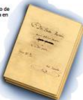
Manuscrito original, 1844

Molière estrenó 'Don Juan o el convidado de piedra' (1665). Goldoni retomó la historia en 'Juan Tenorio o el libertino castigado' (1734) y Mozart compuso la ópera 'Don Giovanni' (1787). Los escritores románticos, como Zorrilla, cambiaron el tratamiento del personaje: Lord Byron compuso el poema 'Don Juan' (1819-1824) y Prosper Mérimée escribió 'Las ánimas del purgatorio'.