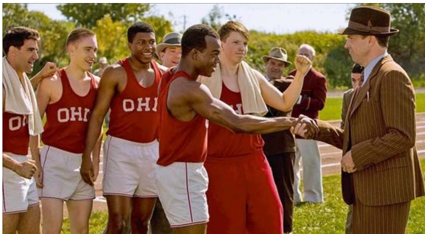
Fotograma de la película 'Race. El héroe de Berlín'.

Algunos hechos históricos lucen tan bien en pantalla que casi podría decirse que sucedieron para ser convertidos en película, y pocos entre ellos son tan fotogénicos como los Juegos Olímpicos de 1936 . Durante unos días de agosto, todo lo heroico que el deporte encarna colisionó con toda la ruindad que la política es capaz de representar.