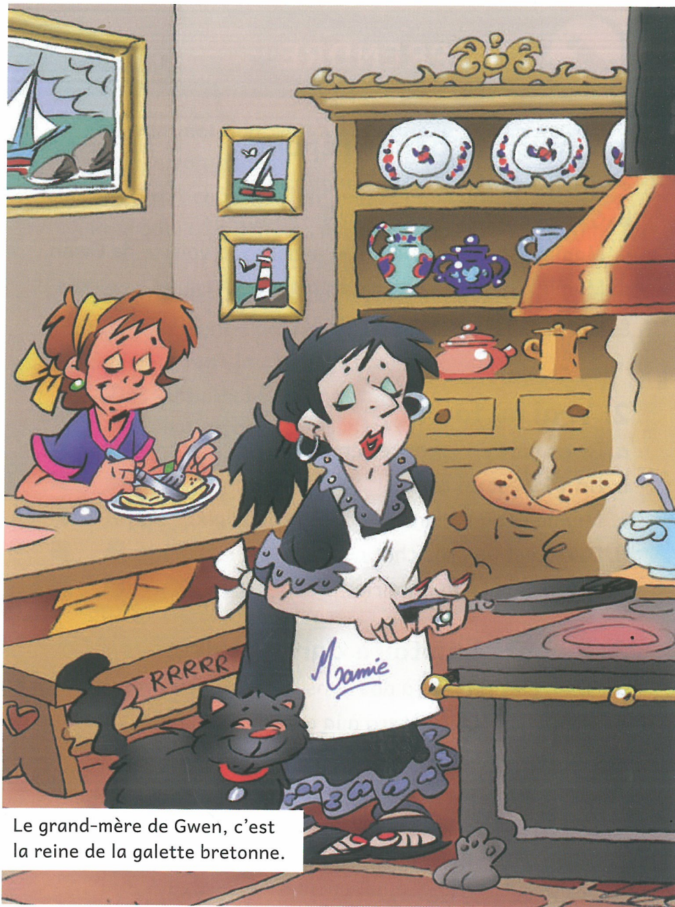
Le grand-mère de Gwen, c'est la reine de la galette bretonne.

Quand elles arrivent enfin à la maison, il est midi. C'est l'heure de déjeuner.