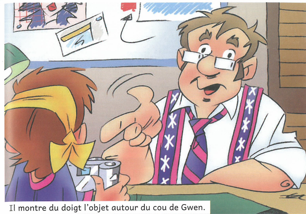
Il montre du doigt l'objet autour du cou de Gwen.

un numérique : un appareil photo sans pellicule.