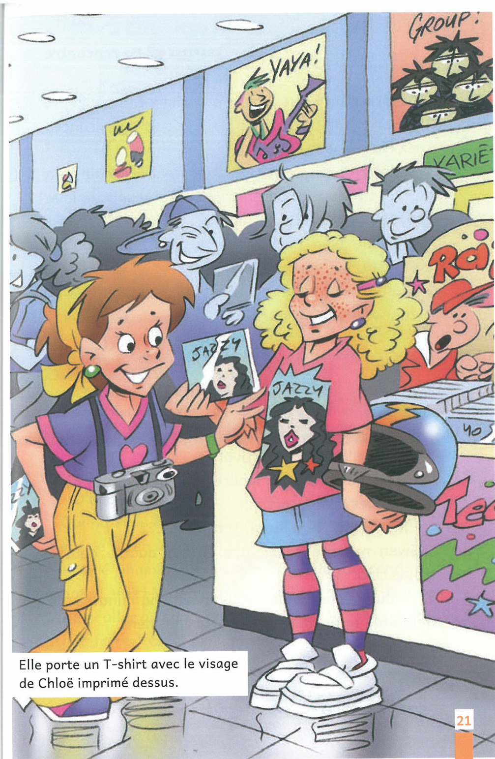
Elle porte un T-shirt avec le visage de Chloë imprimé dessus.