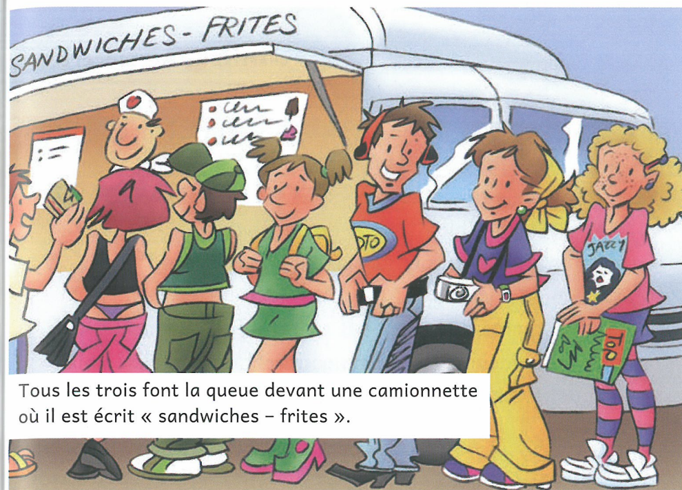
Tous les trois font la queue devant une camionnette où il est écrit « sandwiches - frites ».

c'est leur tour : le moment où ils arrivent devant le vendeur pour acheter les sandwiches.