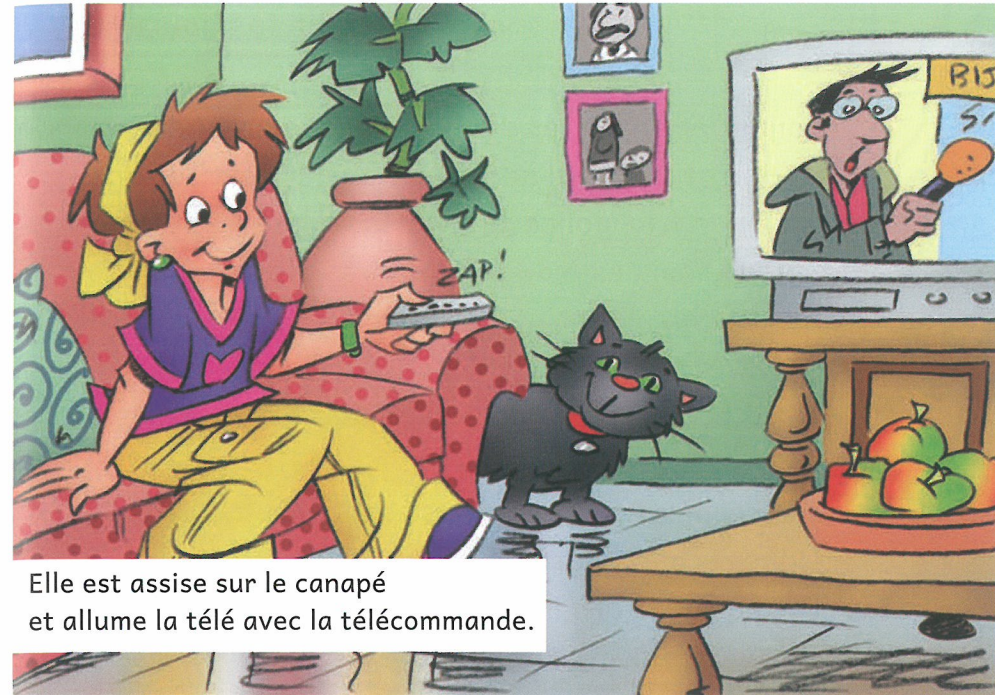
Elle est assise sur le canapé et allume la télé avec la télécommande.

micro en main : un chanteur tient un micro dans sa main pour chanter.