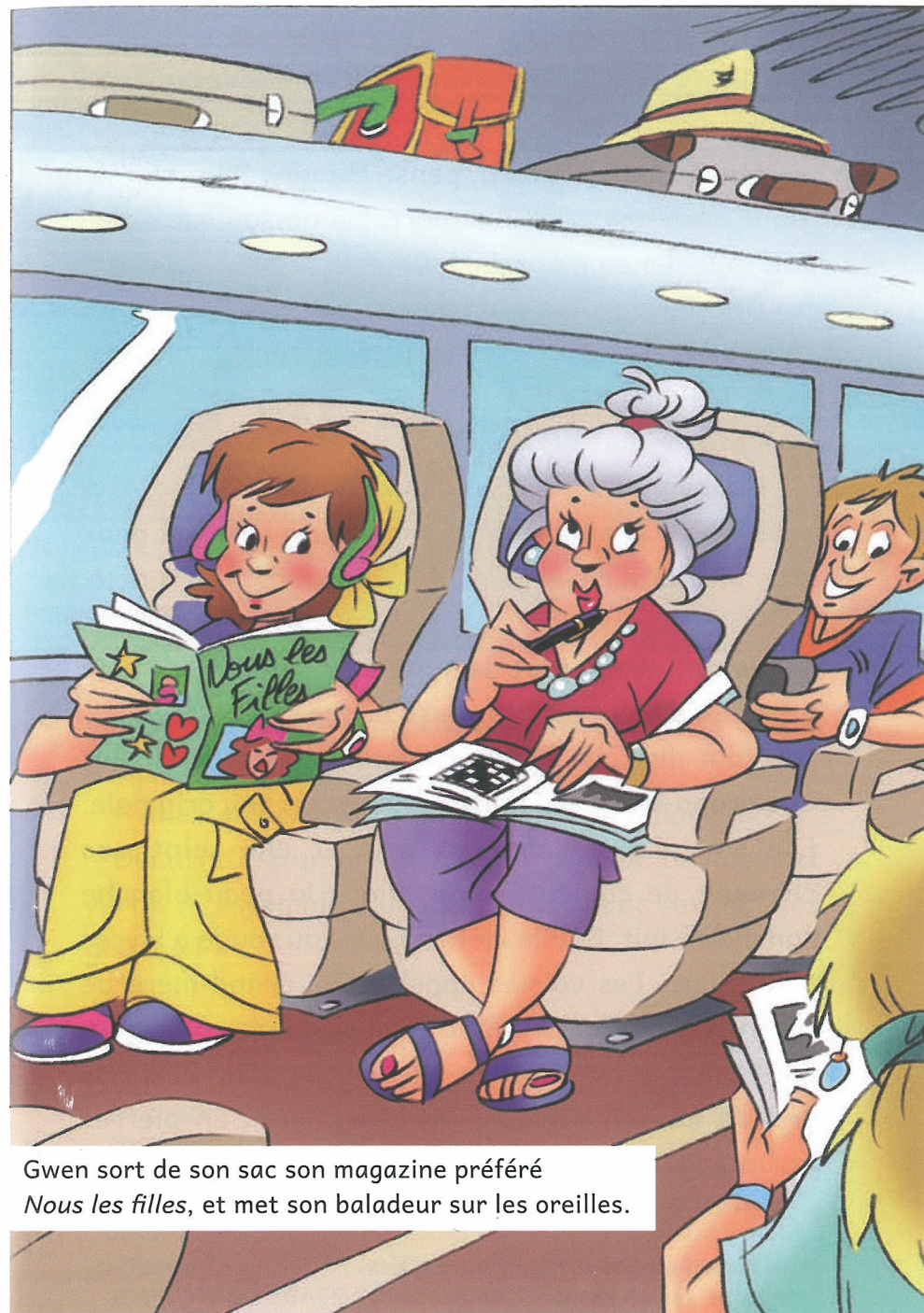
Gwen sort de son sac son magazine préféré Nous les filles , et met son baladeur sur les oreilles.

un quai : dans une gare, les voyageurs marchent sur un quai pour monter ou descendre du train.