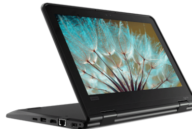
Lenovo Yoga 11e 5th Gen