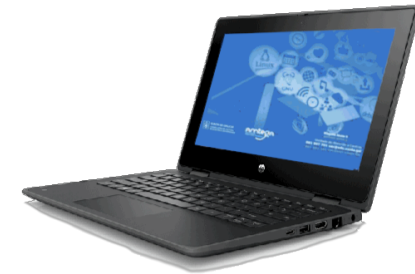
HP ProBook x360 11 G5 EE