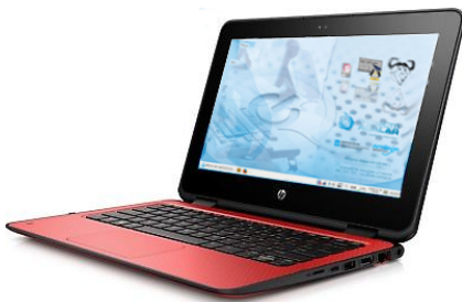
HP ProBook x360 11 G1 EE

No fogar, o/a alumno/a pode conectar o equipo a unha rede WIFI, igual que calquera outro dos seus propios dispositivos persoais.