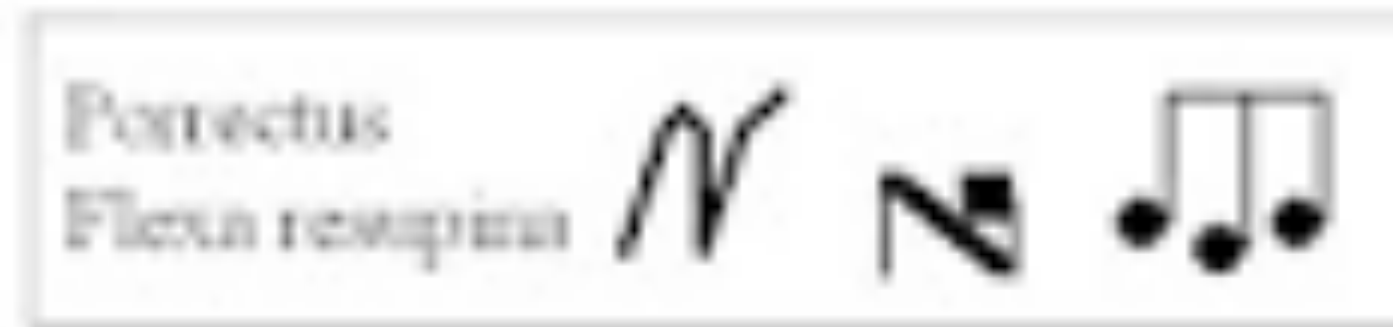
Principales neumas (punctum, virga, pes, clivis, torculus, porrectus)