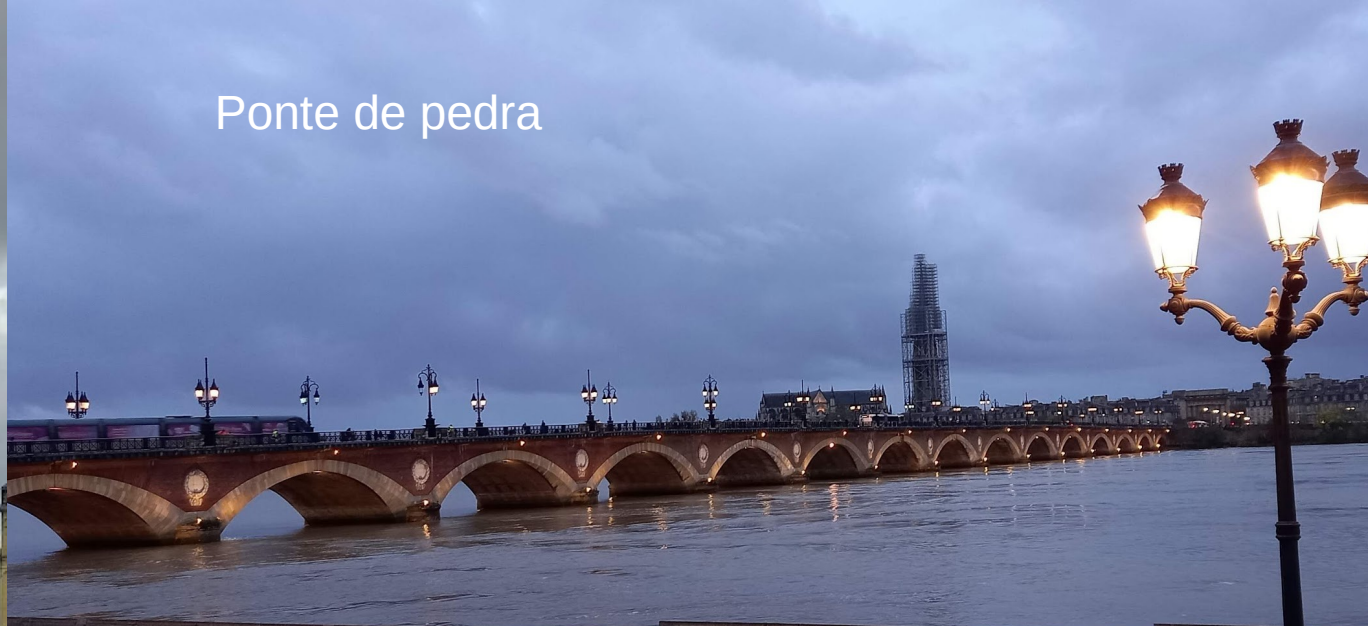
Ponte de pedra