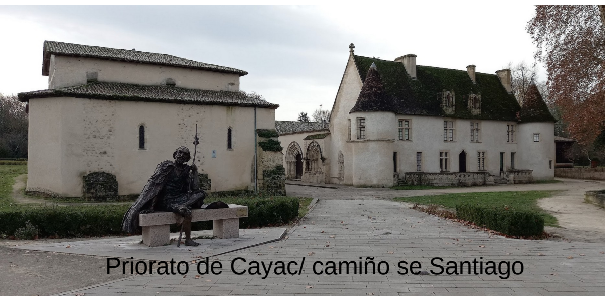
Priorato de Cayac/ camiño se Santiago