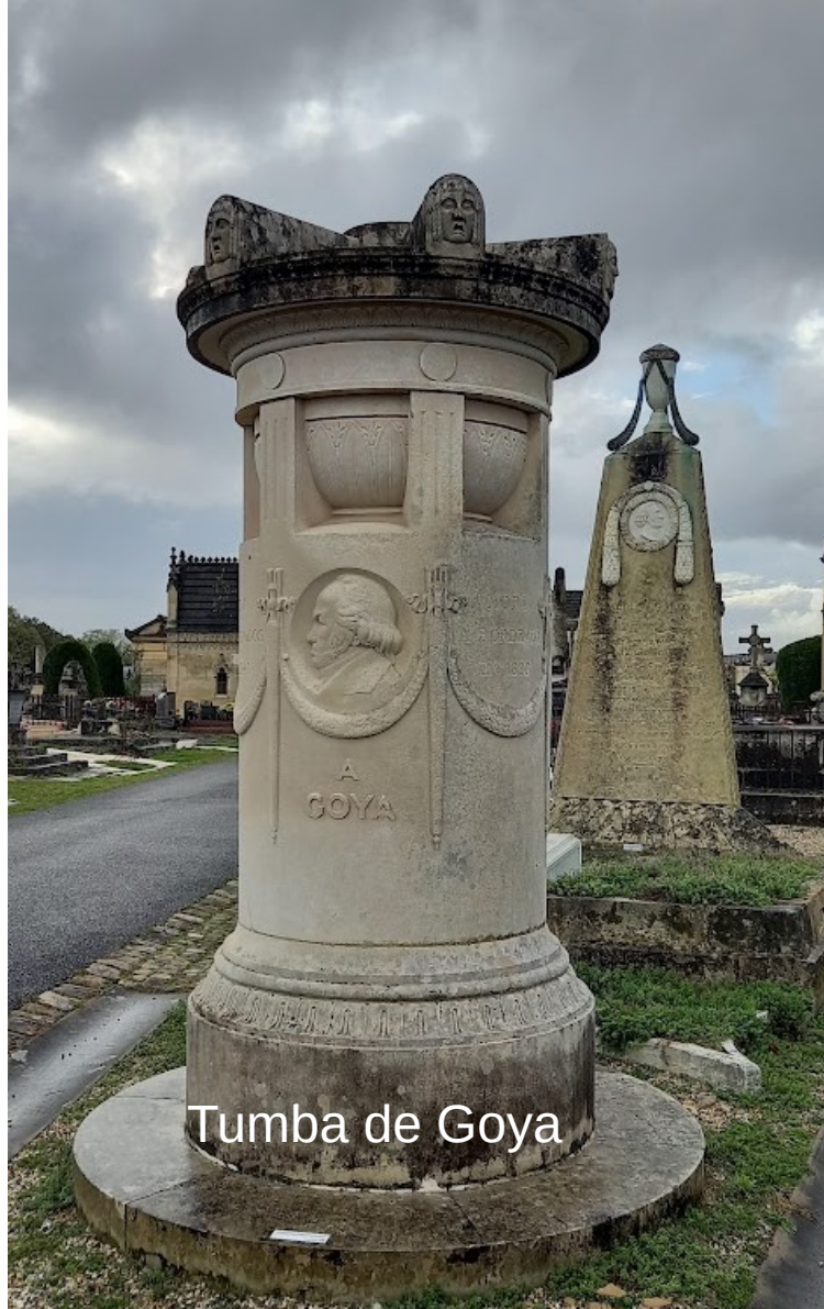
Tumba de Goya