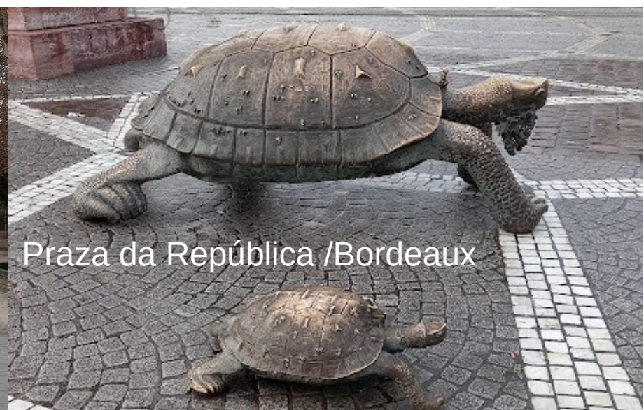
Praza da República /Bordeaux