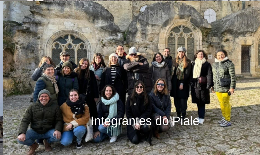
Integrantes do Piale