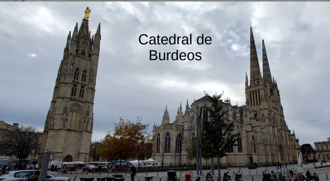
Catedral de Burdeos