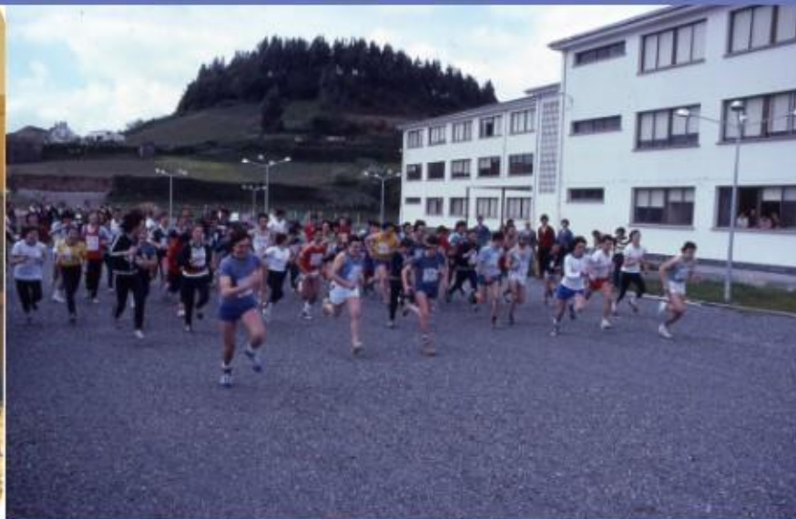
...Colabora abrindo as instalacións: IES de Ortigueira