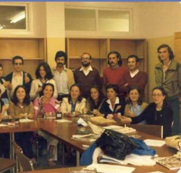
...formada por antigo profesorado do centro