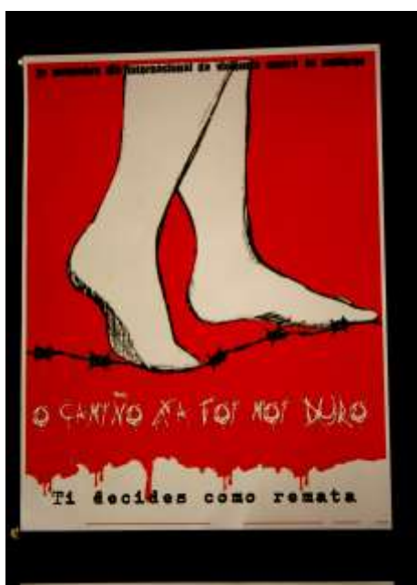
Rocío Meiriño 1º Bach. Categoría C