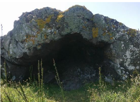
Cova do Ladrón

Continuaron coa ruta, puideron contemplar as distintas especies vexetais entre as que destaca os abundantes eucaliptos que foi introducido en Galicia en 1860 por Frai Rosendo Salvado, pois é unha árbore de rápido crecemento, que desafortunadamente substituíu árbores de mellor calidade como o carballo.