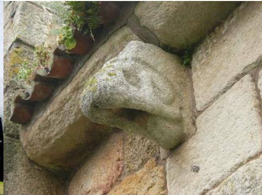
Muller espida da Igrexa