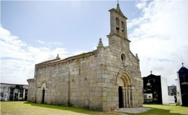
Igrexa de Dexo