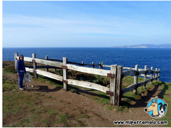
A Furna visitada.

Nunhas rochas cunhas preciosas vistas ó Océano pararon a comer, para coller enerxía. Este fora probablemente o momento no que mais probabilidade de contaxio houbera, xa que no resto da viaxe as normas de seguridade (menos a distancia) foron cumpridas perfectamente e as probabilidades de contaxio serían ínfimas. Continuando coa ruta, o seguinte foi que encontraron uns cágados mortos por culpa dun fungo, o cal está moi presente nas patas dos cans ou na sola dos zapatos. Tras presenciar esta catástrofe, encontráronse co outro grupo e continuaron a viaxe ata chegar ós golfiños onde pararon a beber auga, para chegar finalmente ó Seixo Branco, Monumento Natural de Dexo, son uns acantilados, dende o cal, pódese ver o outro lado da ría coruñesa a Torre de Hércules.