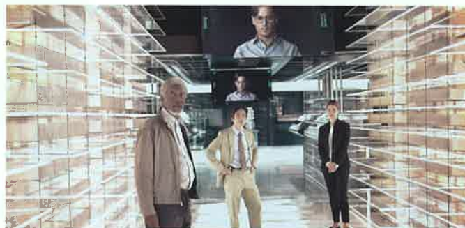
Escena del filme Transcendencia (2014).

–¡Es una difícil pregunta! Y tú, ¿puedes probar que lo eres?