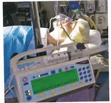
Una persona en coma profundo ha perdido la capacidad de ser consciente de su propio ser y de lo que la rodea.

En cambio, podemos analizarlos cualitativamente : una nostalgia puede ser más o menos intensa, un susto puede ser más o menos grande, pero no podemos medirlos cuantitativamente porque no tienen dimensiones, no son cuerpos; solo suceden en el tiempo.