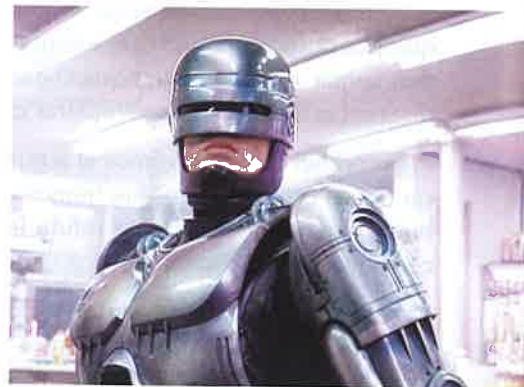
Fotograma del filme de Paul Verhoeven Robocop (1987).