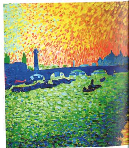
Los colores que percibimos son un ejemplo de hechos mentales o qualia : son diferentes del fenómeno físico de la luz. Maurice VLAMINK: Puente de Waterloo (1906).