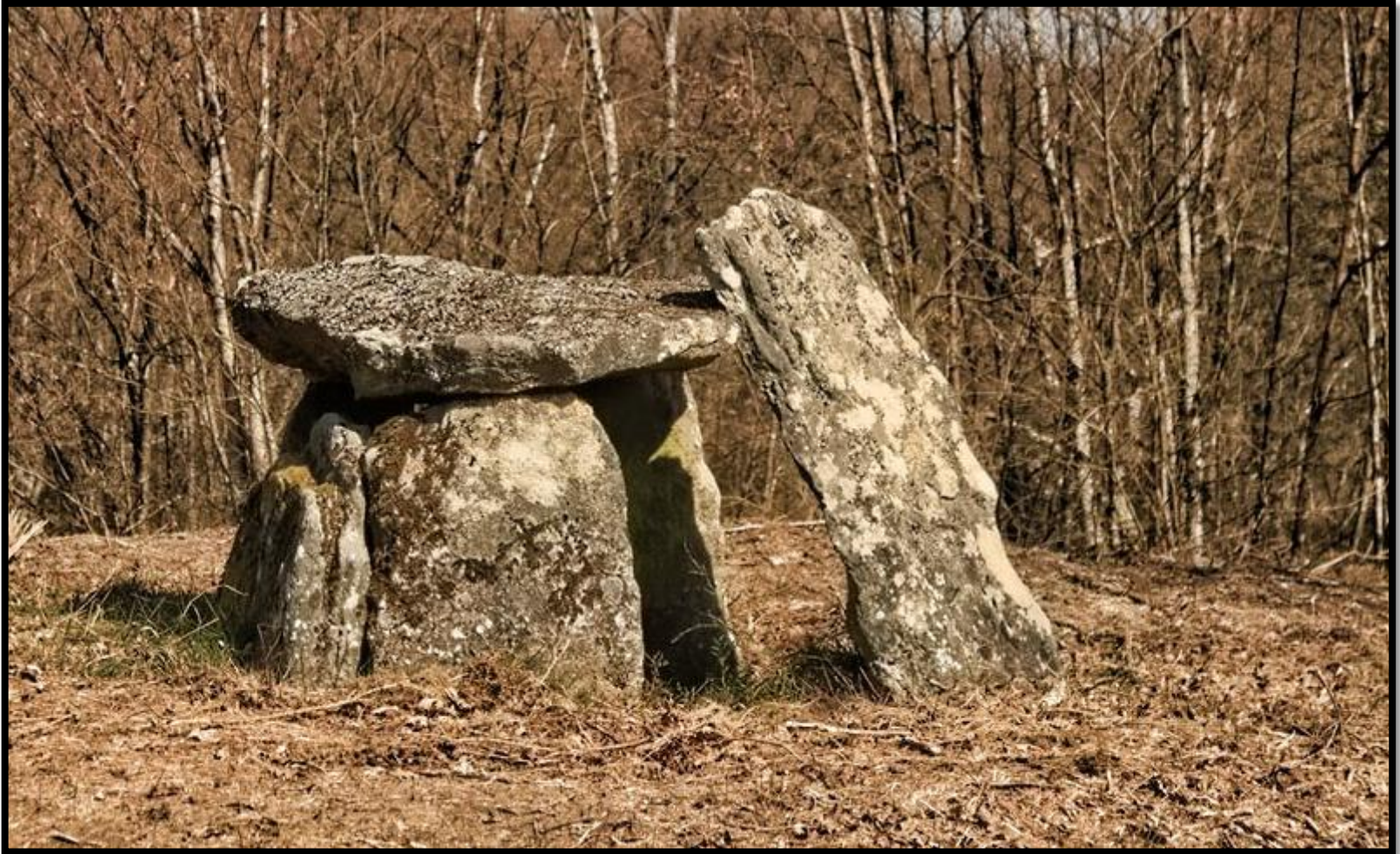
Dolmen da Moruxosa