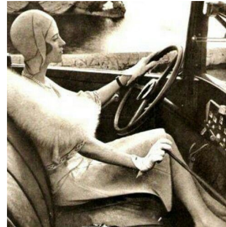
Conducían a altas velocidades