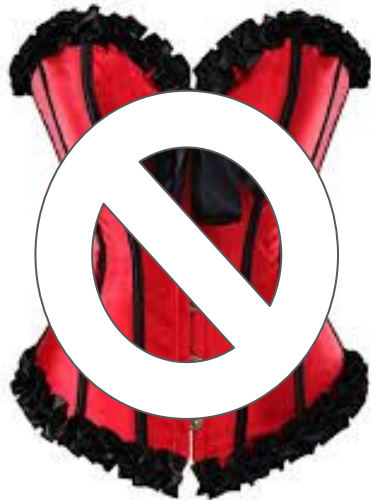
Non levaban corsé