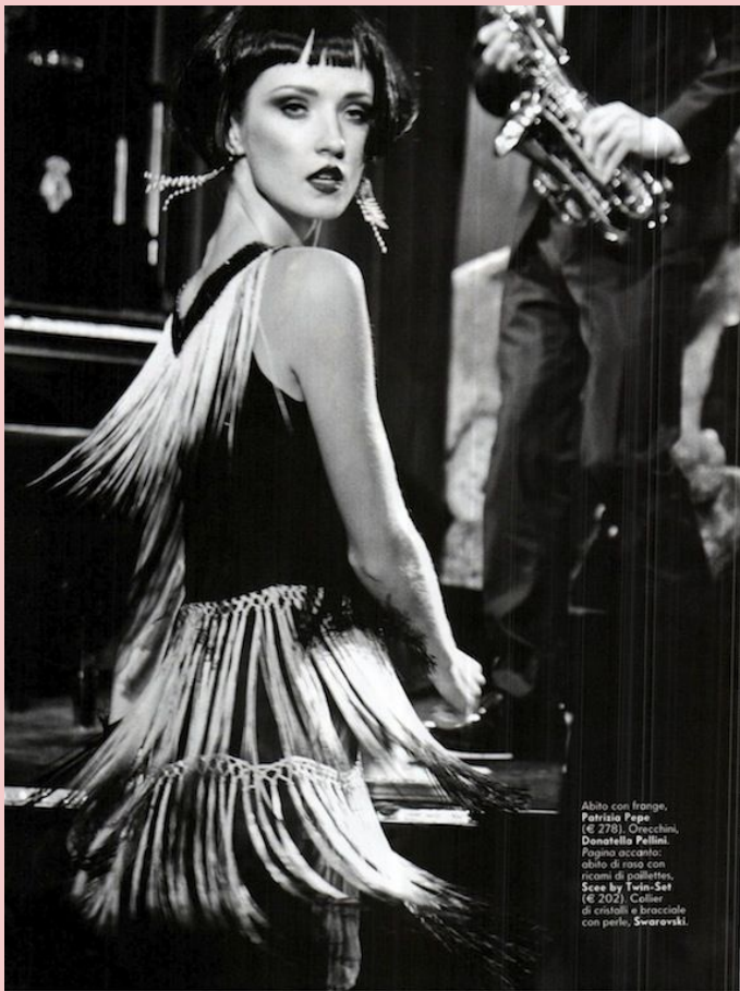
Abito con frange, Patrisio Pepe (€ 279). Orecchini, Danatella Pallini. Pagina accanto: abito di raso con ricami di paillettes, See by Twin-Set (€ 202). Collare di cristalli e bracciale con perle, Swarovski.