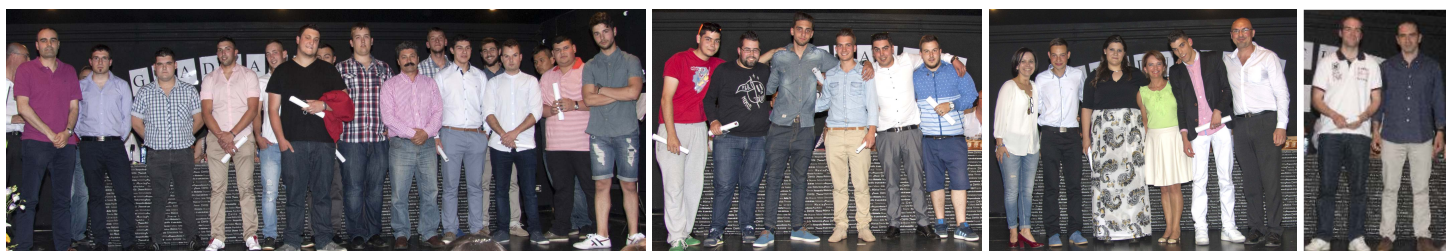
Electromecánica de Vehículos Automóviles, Instalacións Eléctricas e Automáticas, Ciclo Medio de Xestión Administrativa, Sistemas Microinformáticos e Redes