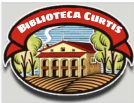
Como en la biblioteca en ningún sitio