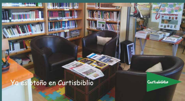
Ya es otoño en Curtisbiblio