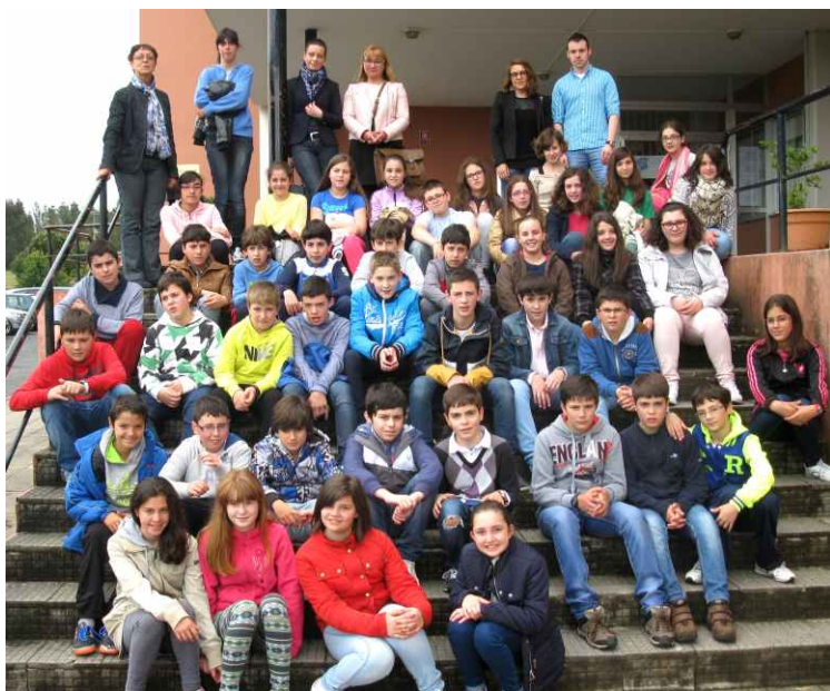
Alumnado de Curtis e Teixeira que en 2014-2015 cursará 1º de ESO no IES de Curtis. A nosa benvida!