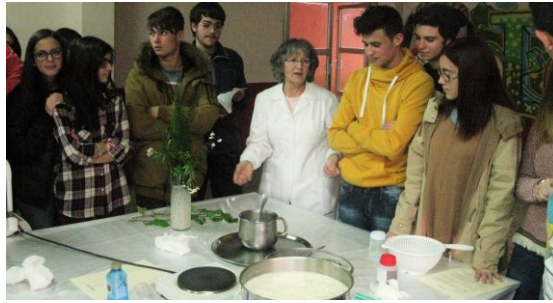
Obradoiro para a elaboración de queixo