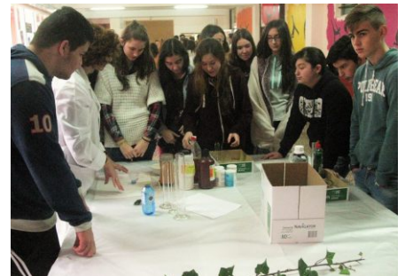
A química ao teu alcance

Parabéns aos seminarios de Física- Química, Matemáticas, Bioloxía e Xeoloxía, Ciencias Naturais, Tecnoloxía, Mantemento de Vehículos, Biblioteca Sarmiento e ENDL por unha xornada na que os contidos curriculares saíron da aula. Tivemos: