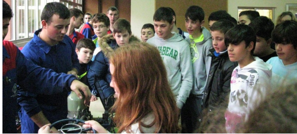
Exposición guiada polo alumnado de Mantemento de Vehículos