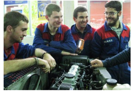
Alumnado de Mantemento de Vehículos