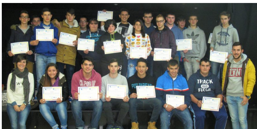
Recollida de diplomas outorgados por Galicia Inxenia