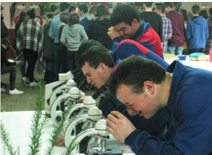
Ollando o diminuto