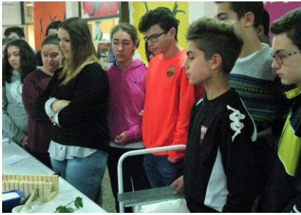
Obradoiro para a fabricación de xabón