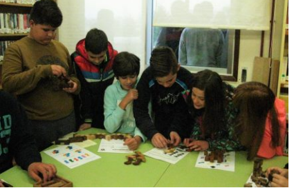
Xogos de enxeño matemático