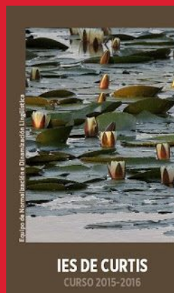
IES DE CURTIS CURSO 2015-2016