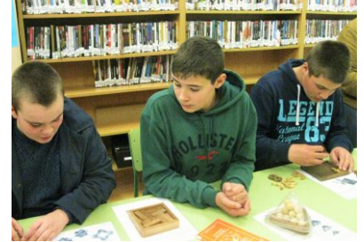
Xogos de enxeño matemático