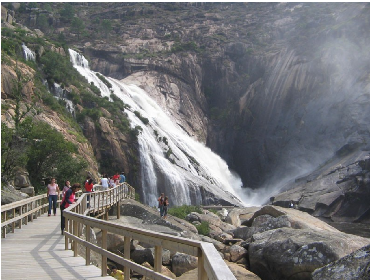
Imaxe 4.- Ferverza do Ézaro

Textos de 1724 falan xa da ferverza, describíndoa coma unha enorme fumareira que podía ser ollada dende varios quilómetros mar adentro.