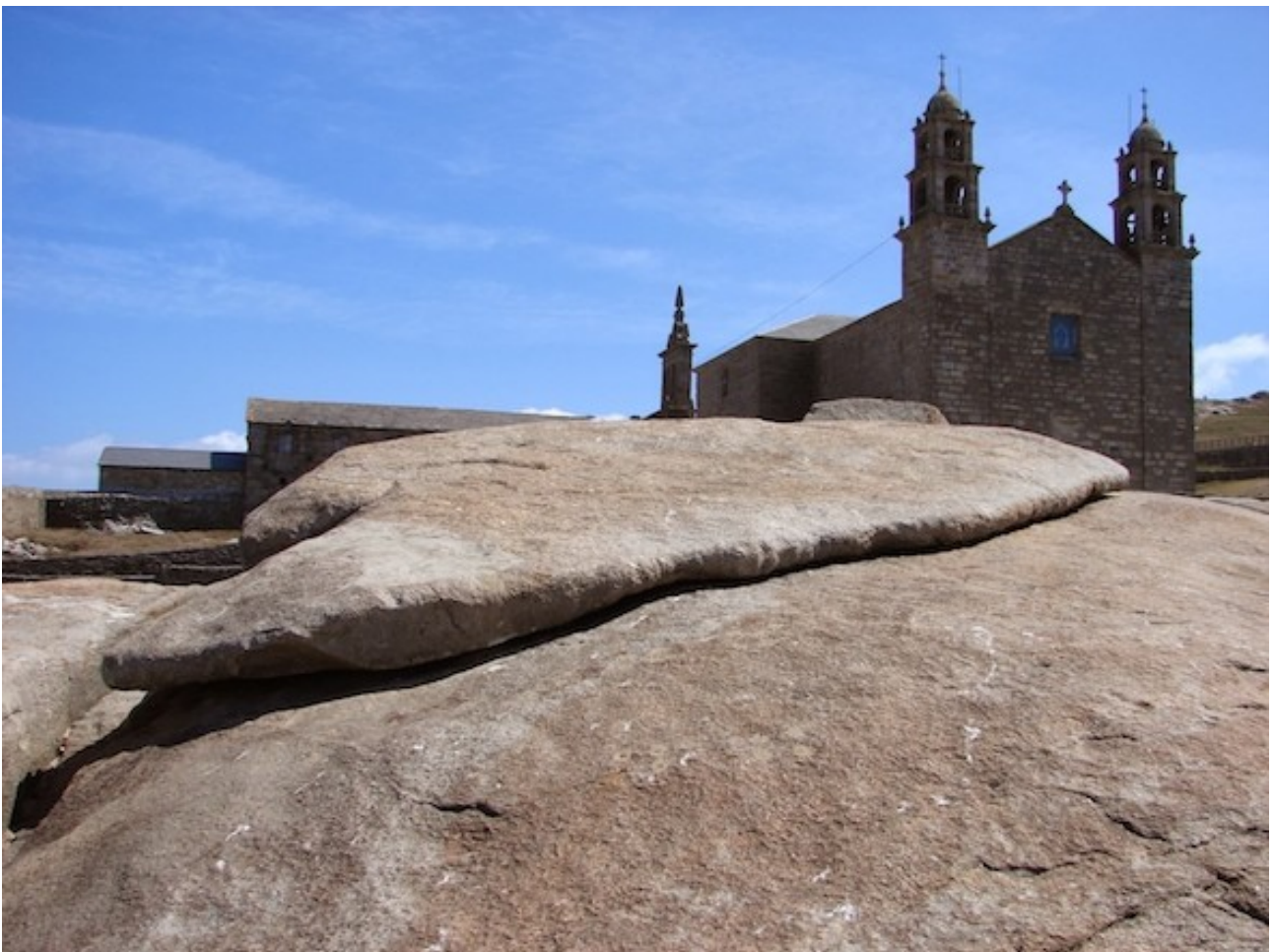
Imaxe 5.- Pedra de Abalar

É un dos santuarios máis antigos de Galicia e a el acoden unha gran cantidade de romeiros. A tradición conta que cando Santiago Apóstolo predicaba por Fisterra sufrindo penalidades e desalentos, aparecéuselle a Virxe nunha barca de pedra guiada por anxos. Como testemuño desta aparición está a barca coñecida como "Pedra de Abalar" e a vela, "Pedra dos Cadrís", que cura de reuma a todo aquel que pase baixo dela.