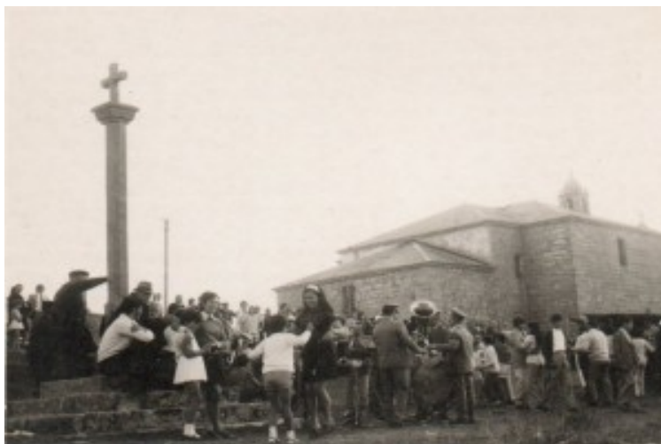
Imaxe 4.-Santuario da Virxe da Barca