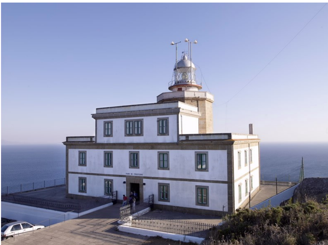
Imaxe 4.- Faro de Fisterra

Durante miles de anos pensouse que cada noite o sol apagábase nas súas augas, e máis alá del só existía unha rexión de tebras e monstros.