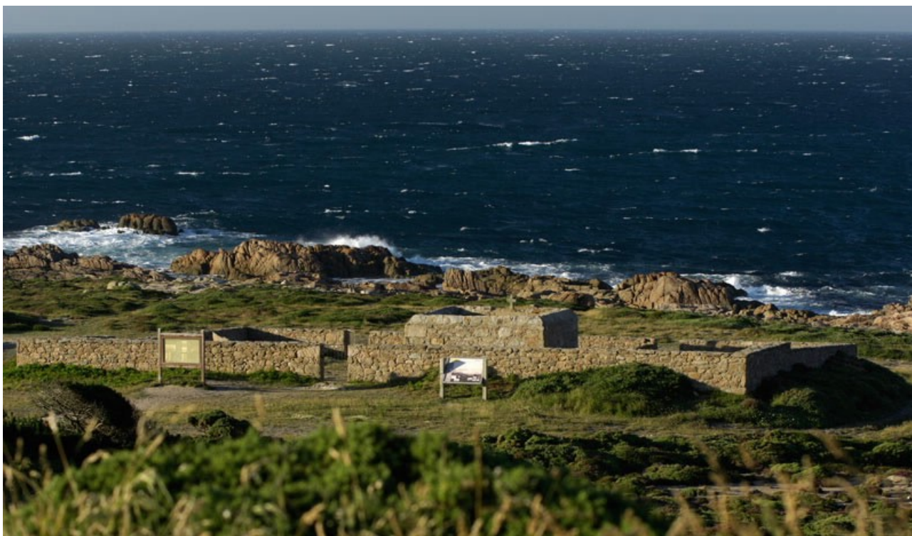
Imaxe 4.- Cemiterio dos ingleses

O almirantazgo inglés agasallou ao pobo de Camariñas, en agradecemento polo seu comportamento, cun barómetro, ao cura de Xaviña cunha escopeta e ao alcalde cun reloxo. Nos primeiros anos trala catástrofe, un barco da armada inglesa achegábase ata o lugar para arroxar unha coroa de flores e cada barco de guerra inglés que pasaba preto destas costas lanzaban unhas salvas de ordenanza na honra dos compañeiros soterrados no Cemiterio Inglés.